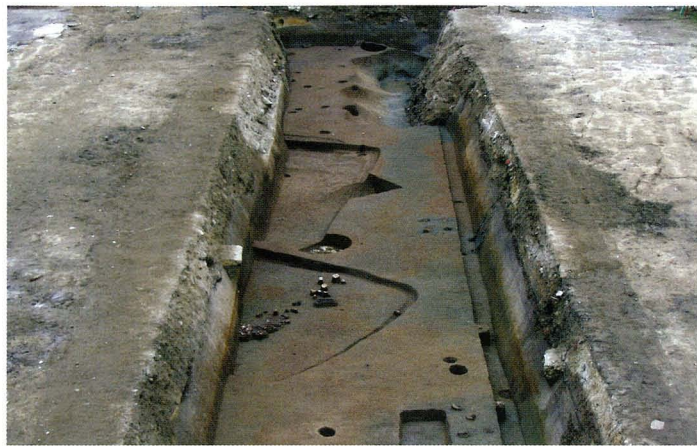
写真2・3 南北道路部分の調査区

すでに埋め戻した南北道路部分の南半部で見つかった竪穴住居(右)と土器の出土状況(左)