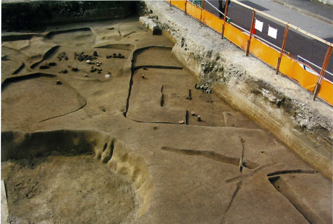
写真5 古墳時代の竪穴住居

古墳時代前期(約1600年前)になると、遺構や遺物の量は減少します。今回の調査では、当時の竪穴住居が1棟見つかりました。この住居は、一段高い床(ベッド状遺構)を南側以外の三方に巡ら めぐ しています。住居の入り口は南側だったのかもしれませんが。住居内からは、土器のほかに、鉄製の矢じり てつそく (鉄鏃)、糸をつむぐ時に使う円板(石製紡錘車 せきせいぼうすいしや )、直径約3mmのガラス製の小玉が見つかりました。