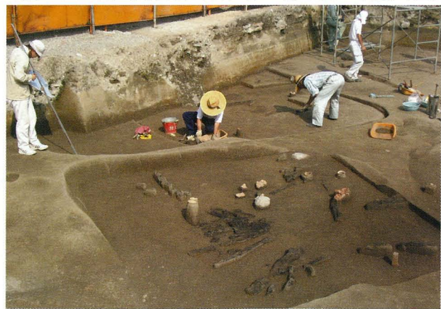
写真4 火事にあつた竪穴住居(手前)

住居内には、当時の人々が使っていた土器などの遺物が多く残されており、当時の集落の出来事を復元する上でのヒントとなります。たとえば、焼けた木材が多く見つかった住居は、火事で燃えてしまったことがわかります。多くの土器の破片が、積み重なるように見つかった住居は、人が住まなくなった後は、ゴミ捨て場になったと考えることができます。また、住居内に粒子の粗い砂が溜まっている例が多く、旧湊川の洪水の被害を受けたあと、短期間のうちに住居の建て替えが行われ、すぐに集落を復興していると考えられます。