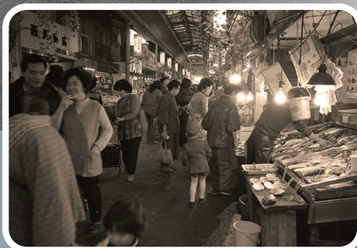
大安亭市場（昭和48年） 3点とも 提供：神戸アーカイブ写真館