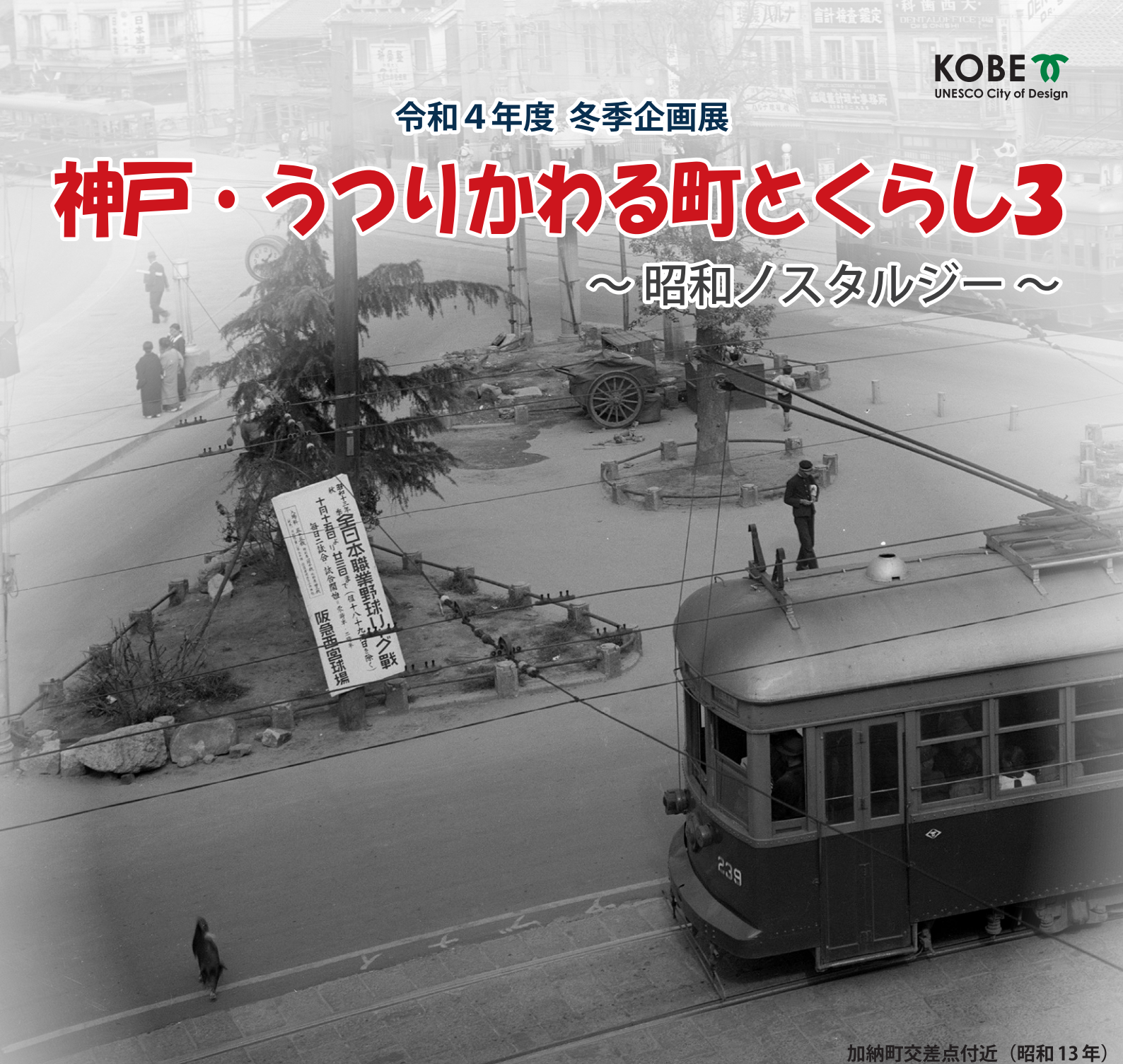
加納町交差点付近（昭和13年）