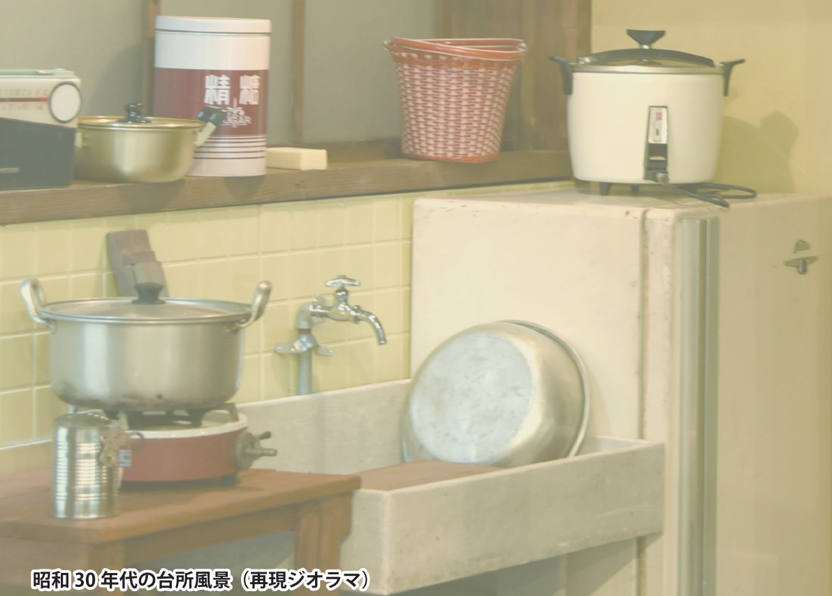
昭和30年代の台所風景（再現ジオラマ）