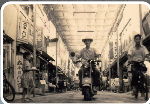
垂水商店街（昭和27年）