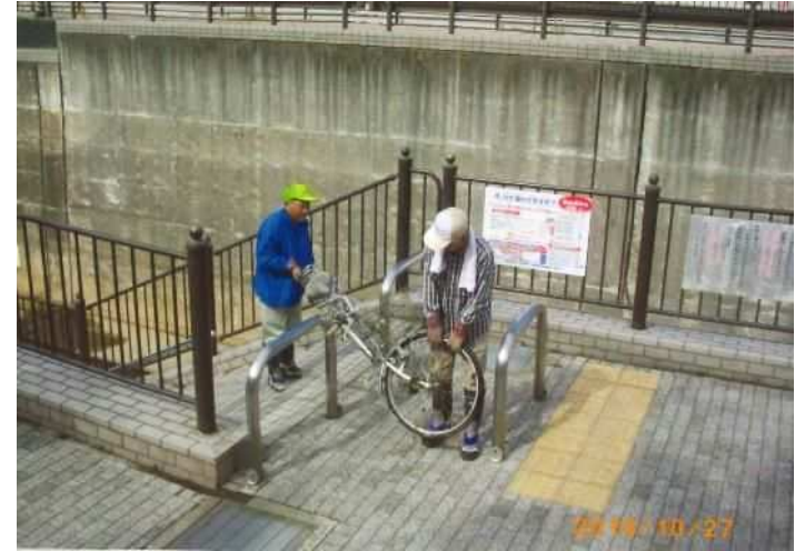
河川内より不法投棄の自転車引き上げ