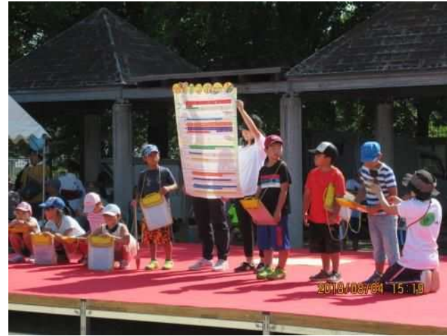
伊川リバーフェスタ