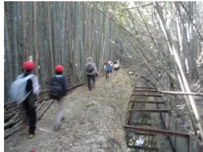
林崎疎水路（郷土学習）