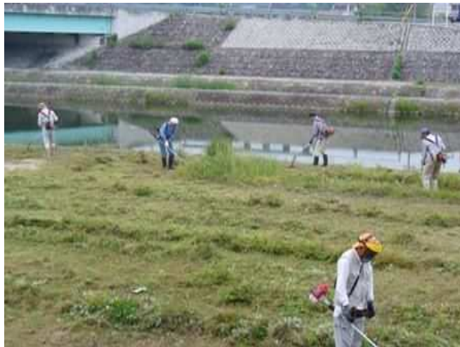
明石川河川敷の草刈