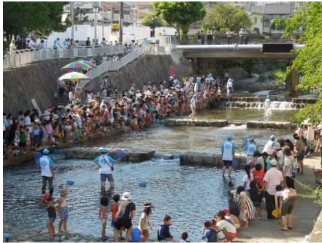
うなぎと金魚のつかみ取り大会