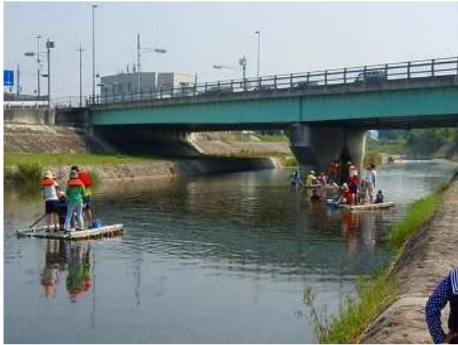
夏イベント（竹製イカダ遊び）