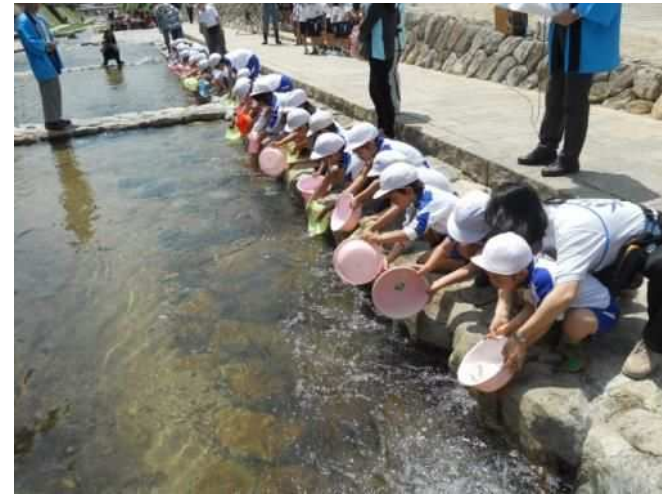
アユの稚魚の放流