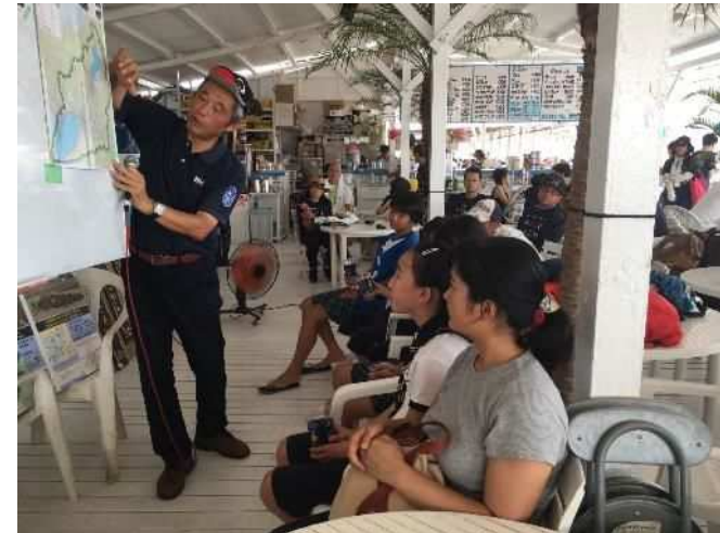
環境セミナーの開催