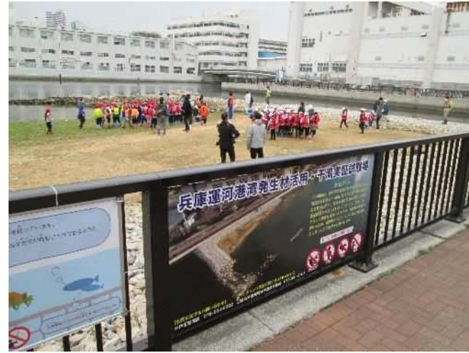
浜山小学校環境学習