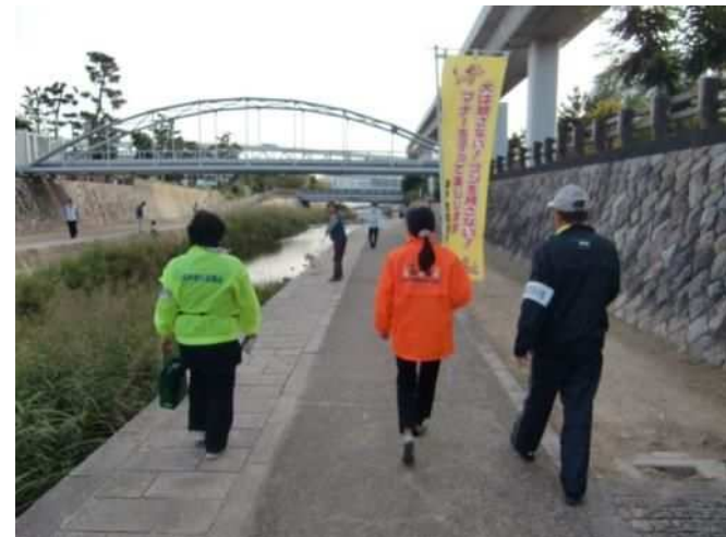
飼い犬パトロール