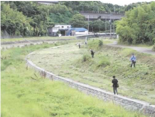
櫛谷川クリーン作戦