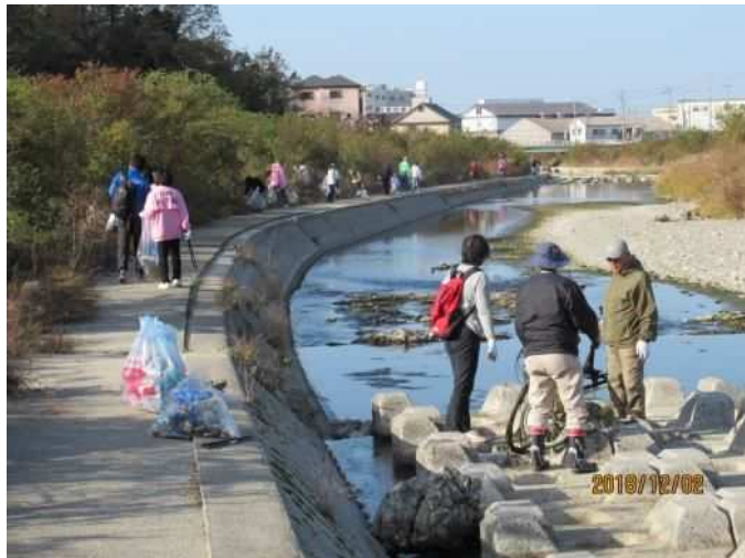
伊川大クリーン作戦