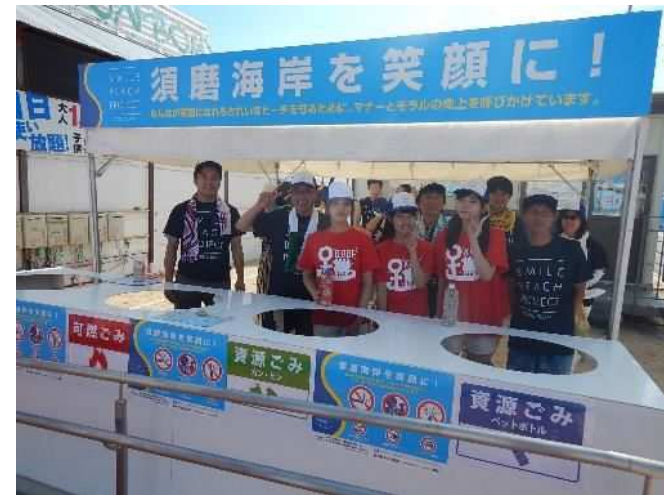
海水浴場開催期間中のマナーアップ活動