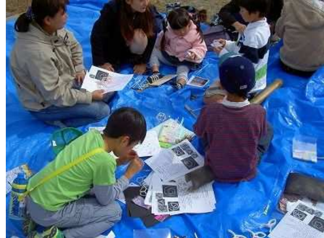
秋イベント（木工工作）