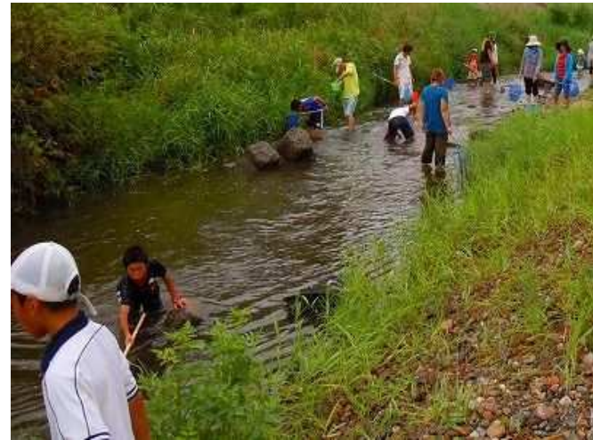
夏イベント（魚とり・水遊び）