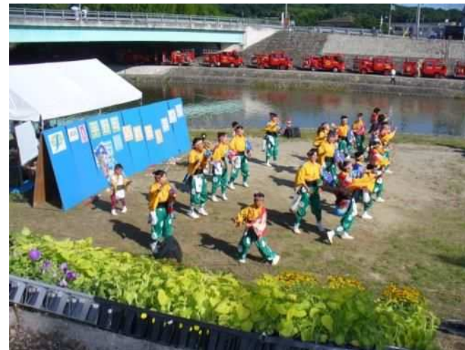
明石川ふれあいまつり（ステージ）