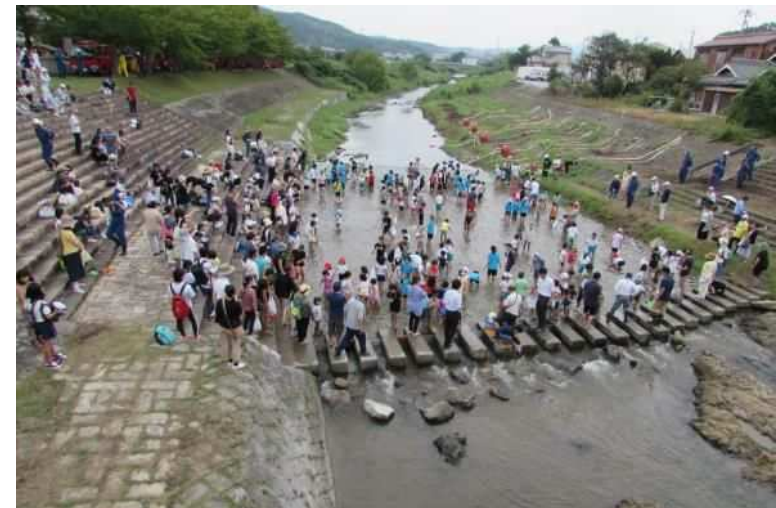
押部谷明石川まつり（さかなとり）