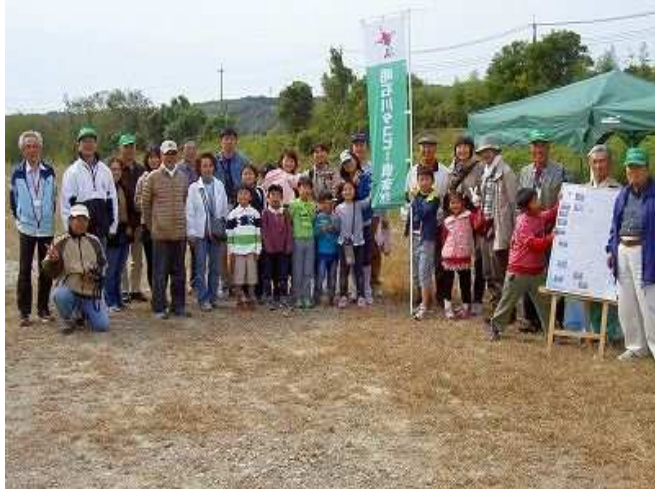
秋イベント（参加者記念撮影）