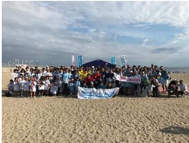
毎月一回の須磨海岸清掃活動