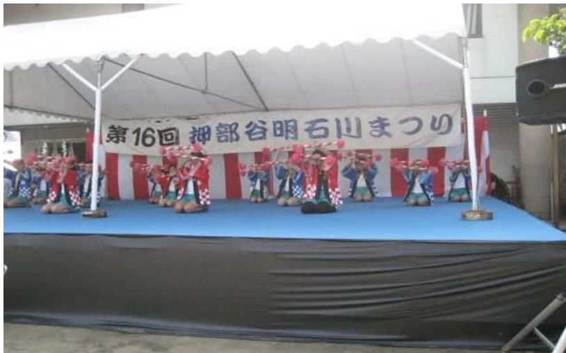
押部谷明石川まつり（ステージ）