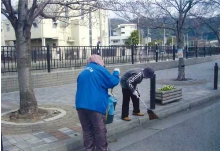
洗心橋付近清掃活動