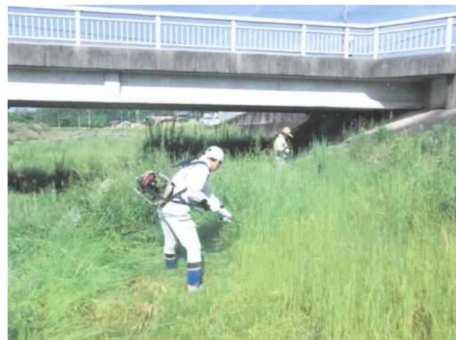
櫛谷川クリーン作戦