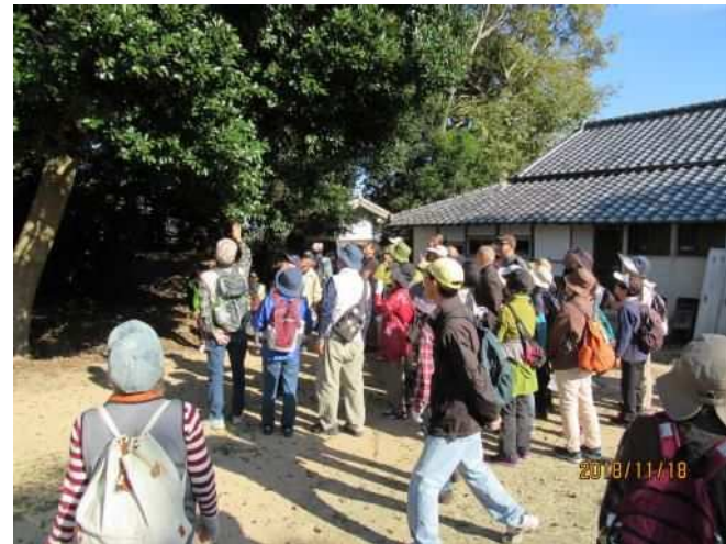
伊川流域ウォーク