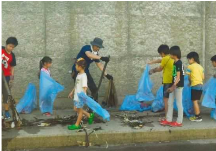
R1,9/29 第8回新湊川まつり・子供たちに依る清掃活動後、川遊びをした。