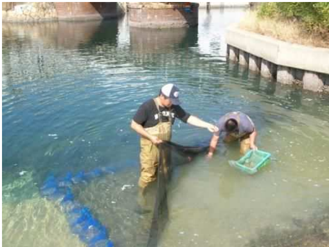
アサリ育成実験場