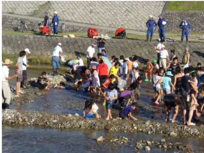
明石川ふれあいまつり（うなぎつかみ）