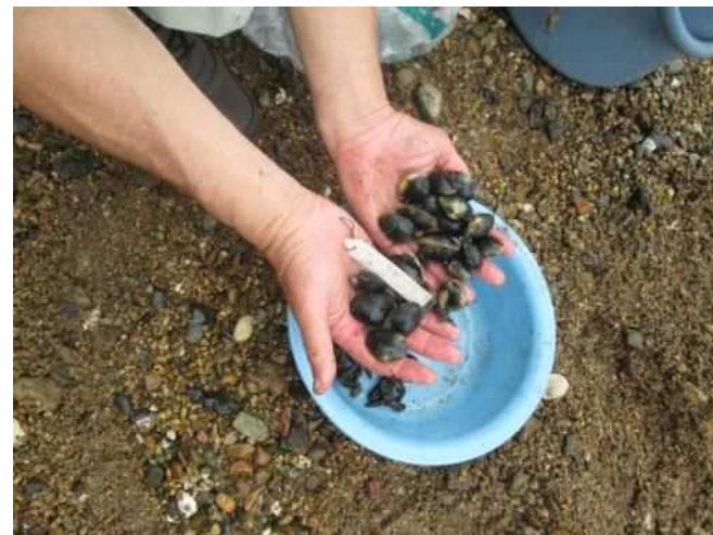
実験場で採れたアサリ