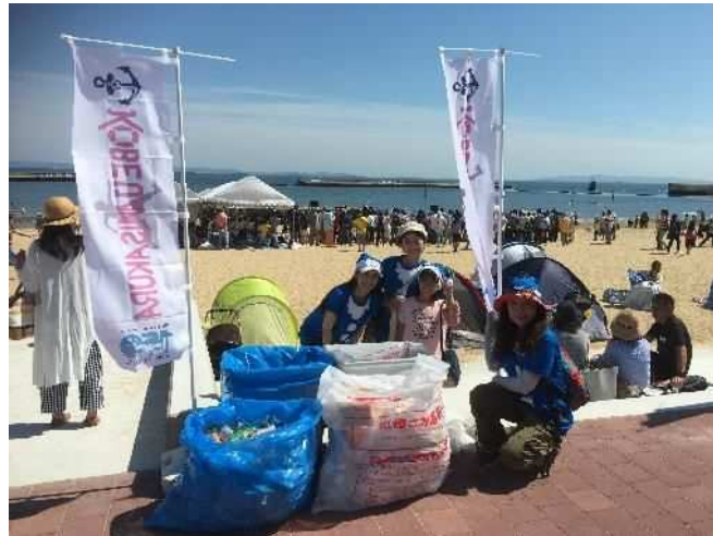
須磨海岸で開催されるイベントでの ごみゼロナビゲーション