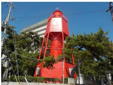
旧和田岬灯台 (文化財) 移設不可