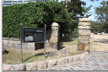
正門遺構 (住友別邸跡)