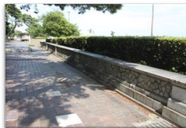
浜側石垣遺構 (住友別邸跡)