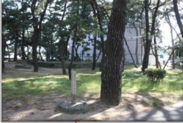
昭和天皇の松 (大正皇太子御手栽の松) 移設不可