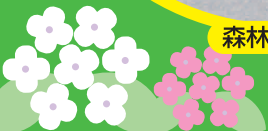
まやビューライン