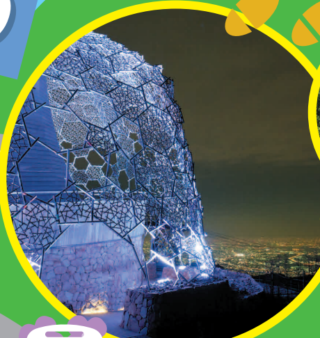
自然体感展望台 六甲枝垂れ