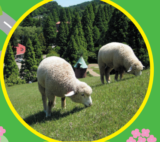
神戸市立六甲山牧場

豊かな自然があふれる六甲・摩耶山 牧場、植物園、ミュージアムなど、見どころ満載 もちろん、景色は圧巻です。