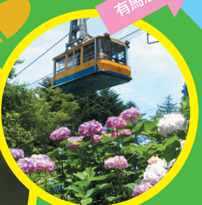
六甲有馬ロープウェー