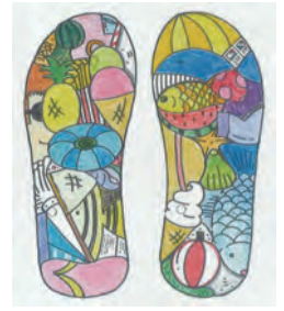
第3回コンテスト NAGATA賞 受賞作品