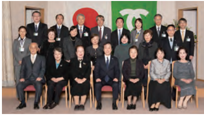
各区婦人会の受賞団体と