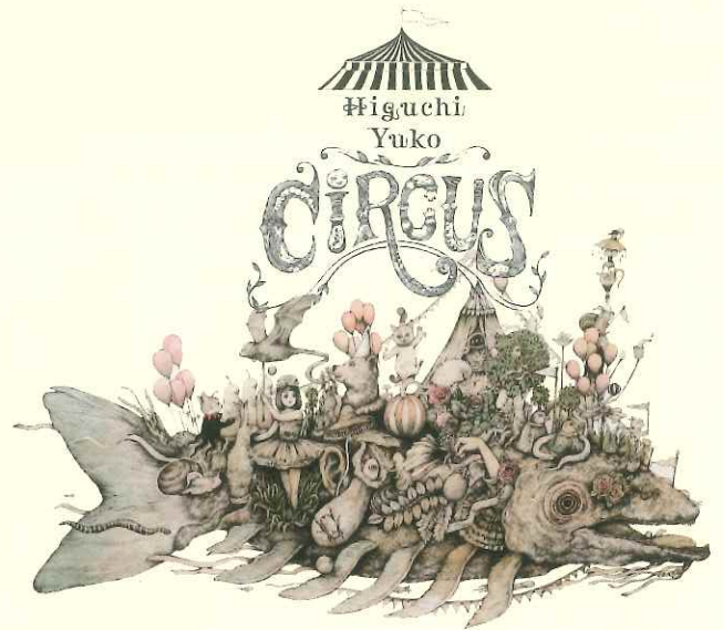
《Circus》2018年 ©Yuko Hiruchi

〒658-0032 神戸市東灘区向洋町中2丁目9-1 Tel. 078-858-1520 http://www.city.kobe.lg.jp/yukarimuseum/