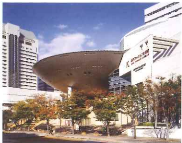
神戸ゆかりの美術館・神戸ファッション美術館 建物外観

六甲アイランドには小磯記念美術館のほかにも、神戸ゆかりの美術館と神戸ファッション美術館があり、芸術・文化ゾーンを形成しています。(3館で相互割引があります。展示の詳細については、各館にお問い合わせください。)