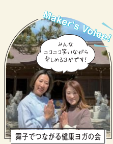
舞子でつながる健康ヨガの会