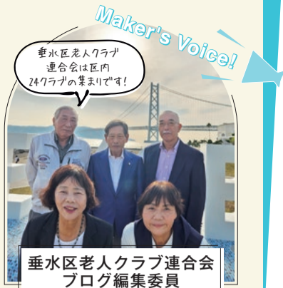
垂水区老人クラブ連合会 ブログ編集委員