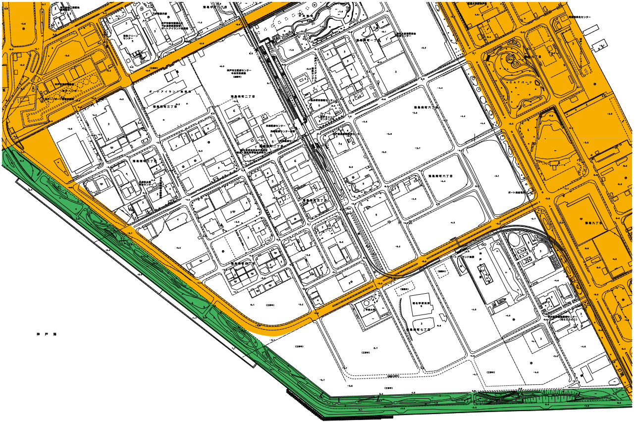
〈 変更前 〉