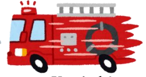
Xe cứu hỏa