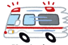
Xe cứu thương