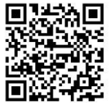
防災ガイドブック

日本では、6月から10月ごろ、たくさんの雨が降ったり、台風の強い風が吹いたりします。安全な所に避難をしましょう。または建物の中の安全な場所ですごしましょう。