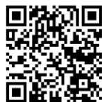
厚生年金・健康保険のご案内