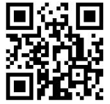
ゴミ分別アプリへ

あなたが利用できるごみを出す場所は決められています。分からない場合は、ご近所の方やマンションの管理会社などにききましょう。ごみを出す日は、ごみ分別アプリで調べられます。（住んでいる地域を選びましょう）