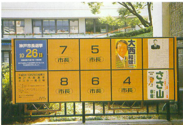
ポスター掲示場（市長）