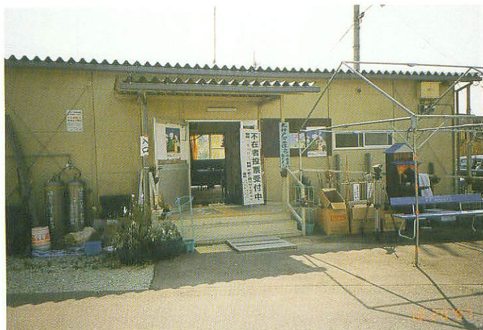
不在者投票臨時受付（北神戸第二住宅）