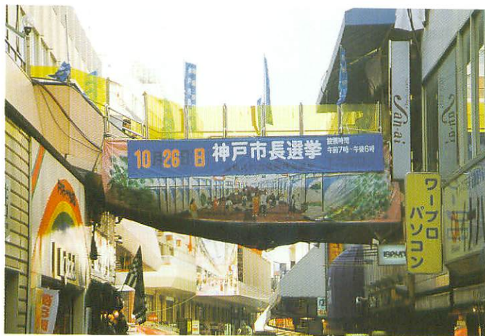
三宮センター街横断幕