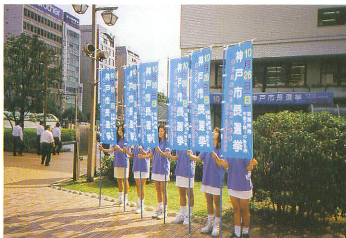
街頭啓発パレード