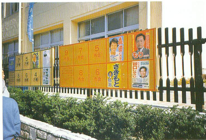
ポスター掲示場（市議補欠）