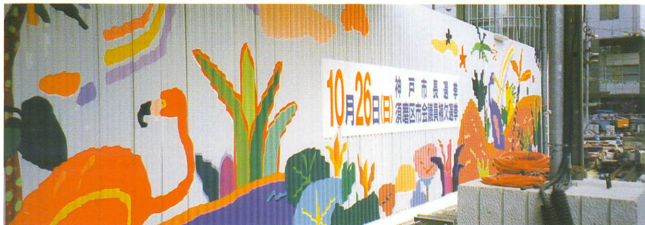
工事用仮囲い壁画制作（新国際会館建設工事現場）