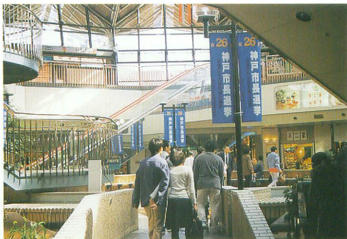
バナー（デュオ神戸）