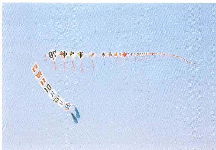
ボランティアによる連風