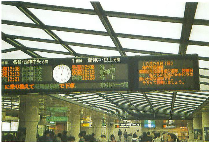
地下鉄LED（三宮駅コンコース）