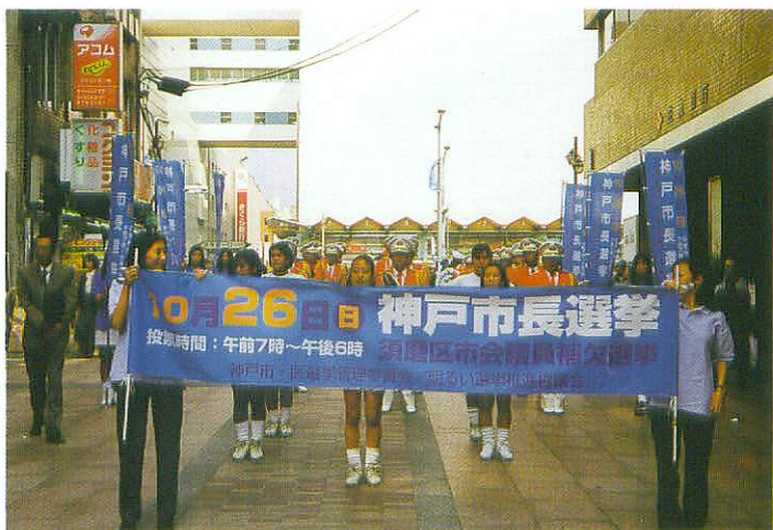
街頭啓発パレード