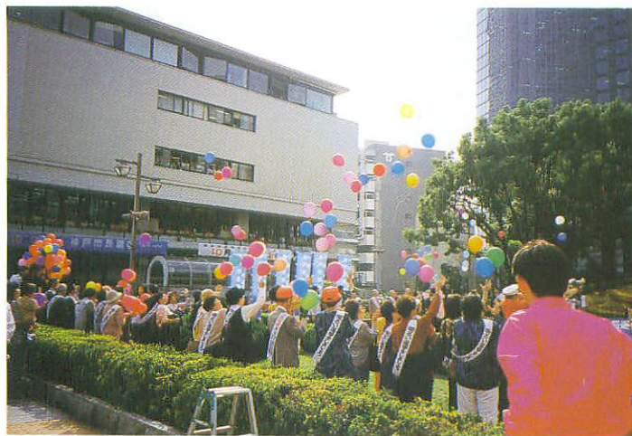
街頭啓発パレード（出発式）