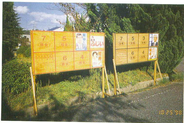
ポスター掲示場（県会議員補欠選挙）