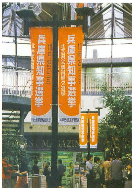
デュオこうベナント