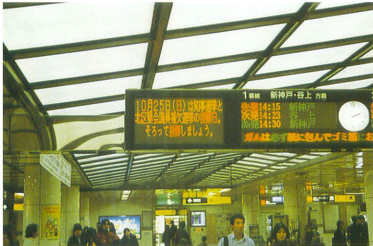
地下鉄LED (三宮駅コンコース)