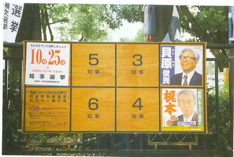
ポスター掲示場（知事選挙）