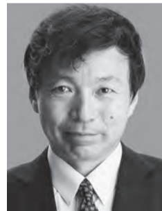
及川幸久 おいかわ ゆきひさ

ユーチューバー「及川幸久 潜在意識チャンネル」、作家、国際政治コメンテーター、幸福実現党外務局長。