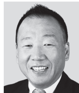
おしま くすお 大島 九州男 参議院議員 現職 平和憲法を 守ります