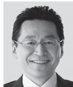
いそざき てつし いそざき 哲史 参議院議員 現職 仲間の思い、 かたちにしたい。