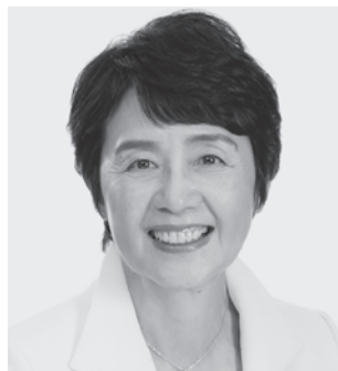
党農林・漁民局長 紙 智子 現 64歳。参院議員3期。