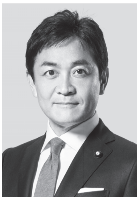
国民民主党 代表 玉木雄一郎