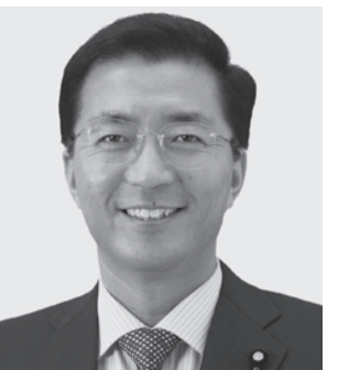
党副委員長 山下よしき 現 59歳。参院議員3期。