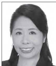
若林 アキ 党女性局長 ジャーナリスト