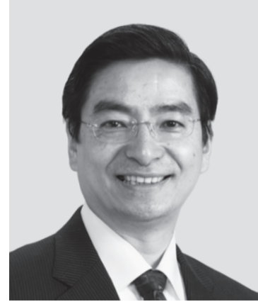
山本 ひろし 現 役職:元財務大臣政務官。 参院議員2期。 経歴:慶應義塾大学法学部卒。 年齢:64歳 現場直結で障がい者支援と地域復興