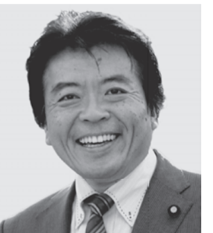
弁護士 仁比そうへい 現 55歳。参院議員2期。党参院国対副委員長。