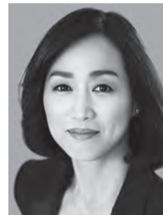
釈りょうこ しゃく

党女性局長を経て現職。2016年、国連女子差別撤廃委員会でスピーチを行う。夕刊紙連載ほか、著書に「繁栄の国づくり」など。