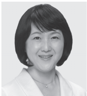
前衆院議員 梅村さえこ 新 55歳。元消費税をなくす全国の会事務局長。