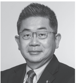
党書記局長 小池 晃 現 59歳。参院議員3期。全国革新懇代表世話人。医師。