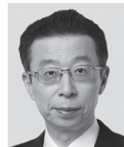
はまの よしふみ 浜野 よしふみ 参議院議員 現職 まっすぐに力強く! 働く仲間のために!