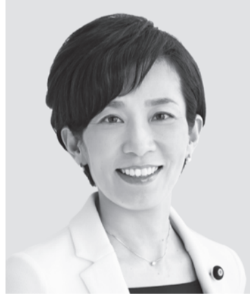
山本 かなえ 現 役職:元厚生労働副大臣。 参院議員3期。 経歴:京大文学部卒。 年齢:48歳 「あなたの声を、かなえるチカラ。」