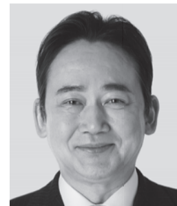
いしがみ としお 石上 としお 参議院議員 現職 全力で聴く。全力で届ける。 全力で挑む。