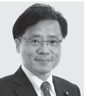
党参院幹事長・国対委員長 井上さとし 現 61歳。参院議員3期。