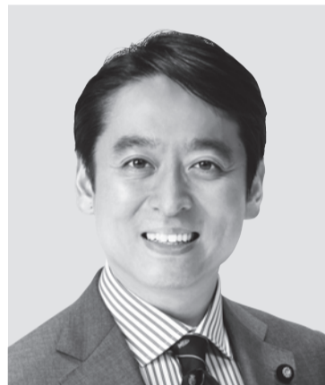
平木 だいさく 現 役職:元経済産業大臣政務官。 参院議員1期。 経歴:東京大学法学部卒。 年齢:44歳 未来をひらく 確かな実力!