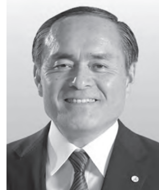
吉田ただとも よしだ 社民党前党首、元参議院議員、 大分県ウエイティング協会会長