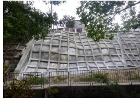
法枠設置工事後 (車1号線)