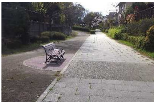
ベンチの設置（六甲アイランド）

また、駅から庁舎へのアクセス性向上のため、新長田合同庁舎の新設に伴い点字ブロック等の整備を行うとともに、移転予定の西区役所周辺については道路整備の検討を行った。名谷駅前については、道路空間の快適性を向上させるため、駅周辺の舗装リニューアルを進めた。