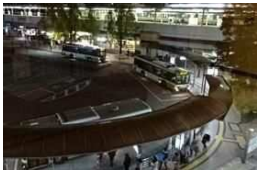
JR 六甲道駅 街灯リニューアル前