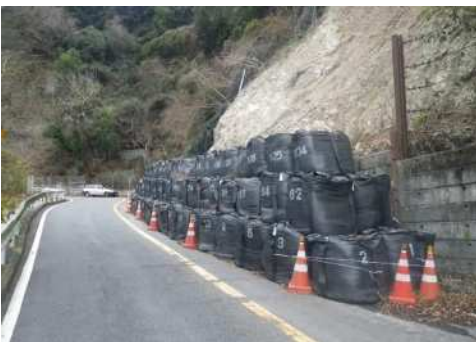
被災時 (神戸六甲線)