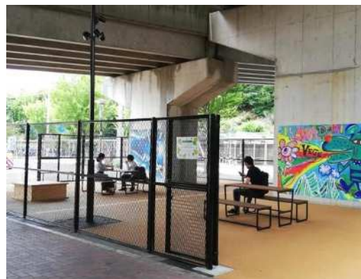
伊川谷駅 桁下空間の高質化（整備後）