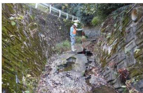
河川管理施設の点検（城山川）