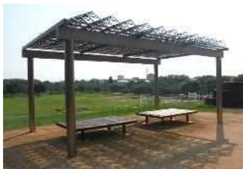
フラクタル構造の日除け屋根の整備（垂水健康公園）