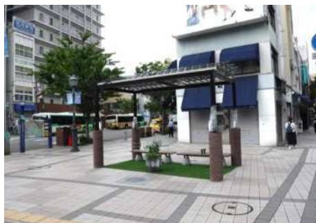
クールスポット実証実験

夏季の異常高温対策として、体感温度を下げるため、都心部の道路上において日除けやミスト装置等を組み合わせたクールスポットの実証実験を行った。また、公園についても、東遊園地等に飾花・装飾したミスト装置を設置するフラワークールスポットの整備を進めるとともに、垂水健康公園等に温度上昇を抑えるフラクタル構造の日除け屋根を設置した。