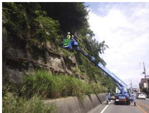
特定道路土工構造物点検（神戸明石線）