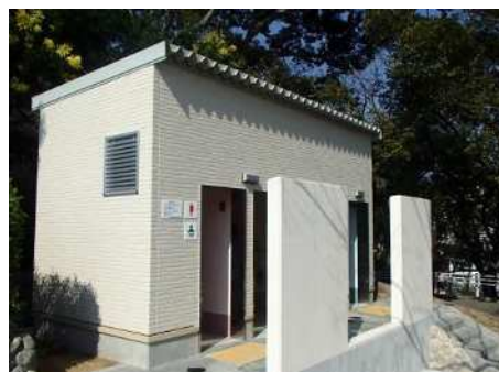
公園トイレチェンジアクションの推進 （会下山公園）