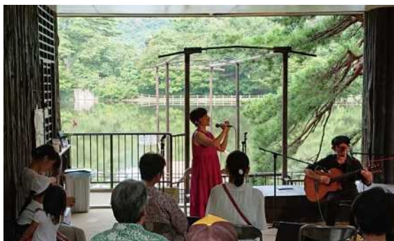
再度公園（コンサート）

さらに、観光客やハイカーの増加に対応するため、布引の滝周辺や六甲最高峰において、快適なトイレ環境の整備に向けた設計・工事を進めた。