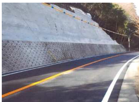
道路法面对策事例(神戸加東線)

令和元年12月に策定した「神戸市無電柱化推進計画」に基づき、市街地の緊急輸送道路を中心に無電柱化事業を推進した。