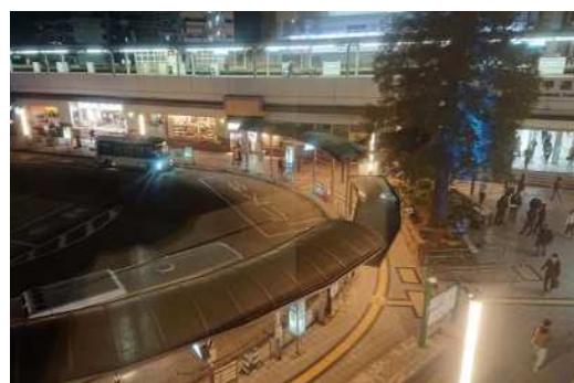
JR 六甲道駅 街灯リニューアル後