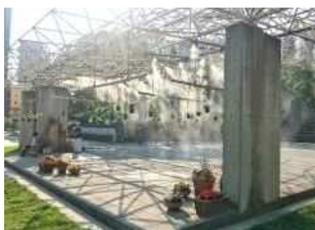
フラワークールスポット（東遊園地）