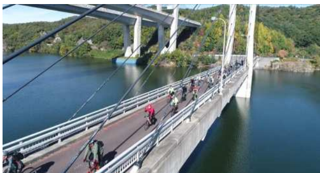
神出山田自転車道リニューアル記念イベント

その他、自転車走行空間については、兵庫区の西出高松前池線において自転車レーンを整備するとともに、利用者にとって安全かつ快適な走行空間を確保するため神出山田自転車道のリニューアルを行い、記念イベントを開催した。