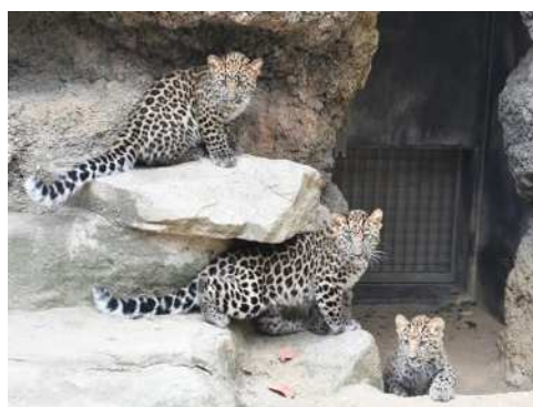
アムールヒョウの赤ちゃん