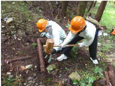
私有林の整備 (下唐櫃地域)

さらに、発生材の利活用においては、森林資源を活用した六甲山ブランドの確立に向けて、兵庫県や(公財)神戸市公園緑化協会との連携により、公共施設を中心にベンチなどへの活用を行った。