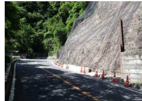
落石防止対策後 (神戸六甲線)