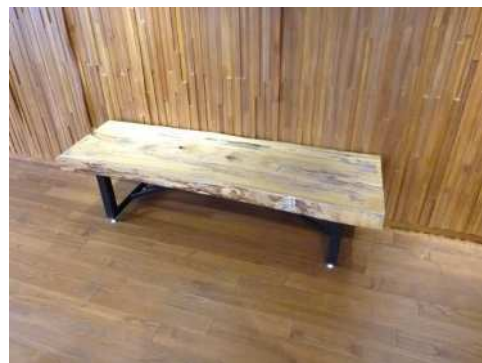
発生材の利活用 (新長田合同庁舎)