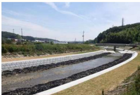
河川の改修（櫛谷川）

生田川については、新神戸駅前広場再整備事業と連携し、市民や観光客に親しまれる親水空間整備の検討を進めた。