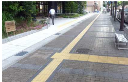
点字ブロック整備（新長田合同庁舎）