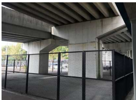
伊川谷駅 桁下空間の高質化（整備前）

また、通学路を含む生活道路などに既に設置しているまちなか街灯について、令和2年度末の完了に向けて賃貸借事業を活用してLED化を進めるとともに、六甲道駅周辺などの駅前広場の街路灯とまちなか街灯の増設を進めた。