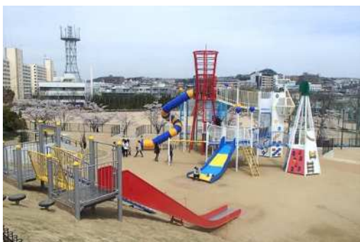
子どもの遊び場拠点の整備（鈴蘭公園）

また、神戸総合運動公園補助競技場において、全国規模の大会が開催可能な環境を確保するため老朽化したトラックの改修に着手した。