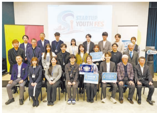
参加者とメンター経営者ら。

次世代の起業家を育成する「カバン持ちプログラム」と「トライアル起業プログラム」に参加した16人の学生・生徒が活動成果を報告する「STARTUP YOUTH FES HYOGO」を3月14日、神戸市内で開催しました。両プログラムは2025(令和7)年度に始まった事業で、前者は県内の経営者をメンターに5日間密着し経営のリアルを学ぶプログラム、後者は専門家の協力を得てビジネスプランを実証するもの。参加者たちは、経営者に同行して学んだことや実際に起業に取り組んだ結果、今後の展望などを発表しました。これからも県は若者の起業を後押しします。