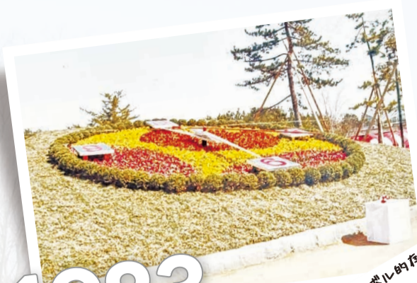
園内のシンボリック的存在の「花時計」が竣工。