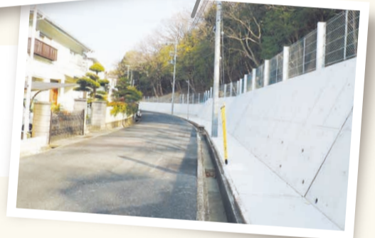
崖崩れから人命を守るため、擁壁工事等の急傾斜地対策を実施(写真は垂水区)。