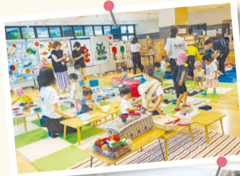
地域交流やイベントなど、さまざまな活動を支援する施設を整備。