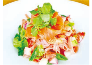
「PASTA FRESCA DAN-MEN」の「淡路島サクラマスのプリマペーラ」(1,660円)

ヤマメの稚魚のうち、成魚になっても川にとどまる個体がヤマメ、海に向かう個体がサクラマスです。サクラマスにするには体色を銀色に変化させないといけません。初年度は半数しか変化せず、しかも大雨で多くを死なせてしまいました。2025年には仕入れ先を変え、県外育成施設も視察して研究し、ほぼ全てを銀色にして福良に届けることができました。来季は神河町に残した個体から採卵し、「卵から兵庫産」を目指します。