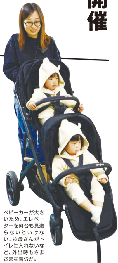
ベビーカーが大きいので、エレベーターを何台も見送らないといけない、お母さんがトイレに入れないなど、外出時もさまざまな苦労が。

多胎児の家庭に対する外出環境支援事業…子ども2人以上乗りベビーカーなどの購入費用等の半額(上限2万円)を補助しています(本年度は6月ごろから受け付け開始予定)