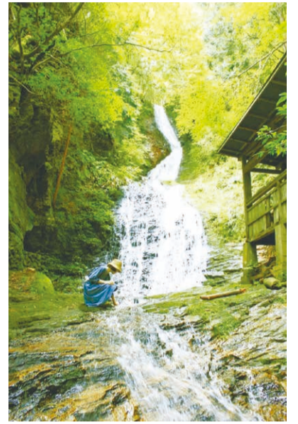
ツアーでは、コケはもちろん滝なども見ることができます。