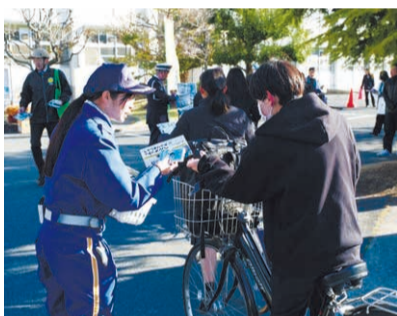
登校時には啓発チラシを配布。

県では、自転車交通事故の年齢層別発生率が最も高い高校生を対象に、自転車の安全利用を呼びかけています。自転車の交通反則通告制度(青切符)の開始を前に3月10日、兵庫県警察等と合同で県立姫路南・姫路海稜高校で啓発活動を実施。自転車に関係した交通事故の発生状況や違反行為について解説し、交通ルールの順守やヘルメット着用の重要性を伝えました。