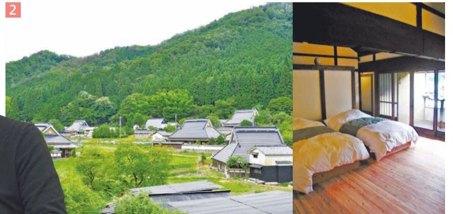
1 才本さんは、地域の古民家再生の取り組みを支援する県空き家改修アドバイザーを今年3月まで務めました。2 「集落丸山」は、古民家活用の成功事例として全国から注目を集めました。右は客室。