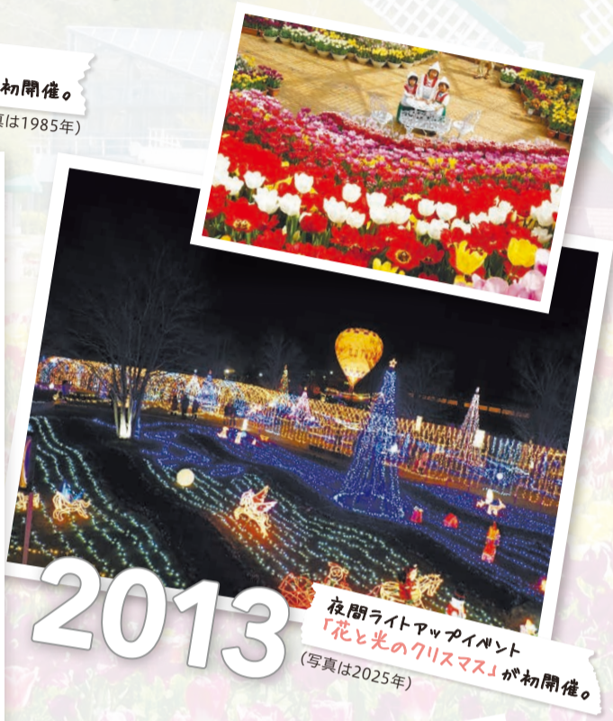
夜間ライトアップイベント「花と光のクリスマス」が初開催。 (写真は2025年)