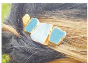
パレットの他、指輪やペンダントなど好きなアクセサリーが作れます。