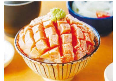
「絶景レストラン うずの丘」の「淡路島サクラマス炙り花咲丼」(2,420円)