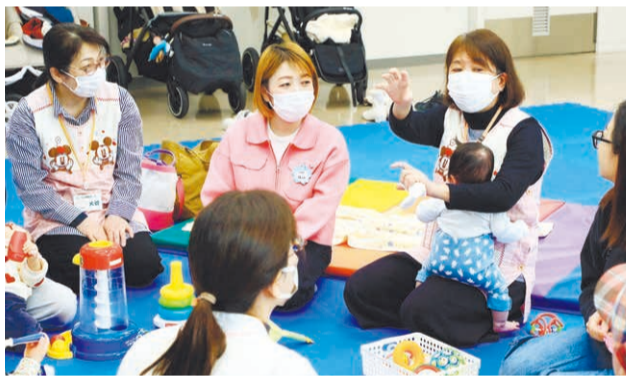
神戸市の多胎児子育て教室の運営にも携わり、先輩スタッフとして多胎ならではの育児経験を伝えています。

Q.多胎児育児で特に大切なことは。 出産前から母体の負担は大きく、7割以上が帝王切開です。多くの場合、小さく生まれるので特にケアが必要となり、母親は自分の体が回復しないうちに、眠れない、外出できない日々が始まります。過酷な育児の中で、親も、手伝える家族も疲弊します。ですが、多胎育児ならではの工夫もあります。少しでも楽に安心できる育児をするために、妊娠中から正しい情報とつながりを持つことが大切です。 Q.団体ではどのような活動を。 安心して情報交換や仲間づくりができるように、行政や専門職と多胎育児経験者が連携し、産前教室やオンライン