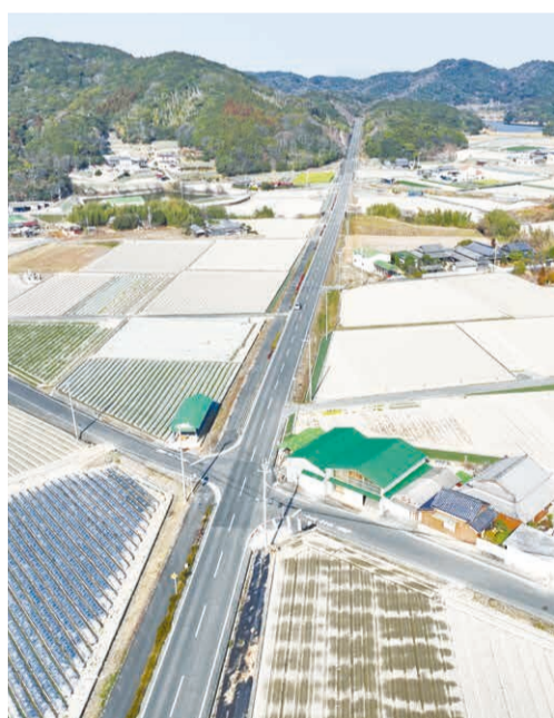
田園地帯に整備された「オニオンロード」。