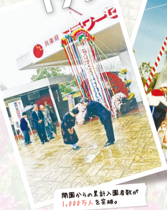
開園からの累計入園者数が1,000万人を突破。