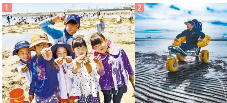
1 遠浅の美しい砂浜が続く白浜海岸。アサリやハマグリ、マテ貝が採れます。2 ホームページの予約フォームから連絡すれば、それぞれに合ったサポートが受けられます。

姫路市の白浜海岸では昨年、8年ぶりに潮干狩りを再開し、短期間にもかかわらず4,000人を超える来場者でにぎわいました。ここで生まれる笑顔やにぎわいを地域に根付く風景として未来へつないでいきたいとの思いから、今年是全国的にも珍しい、秋まで楽しめるロングラン開催に挑戦しています。また、5月16日(土)からは、全ての人に開かれた海を目指したユニバーサル潮干狩り(予約制)として、水陸両用アウトドア車椅子や砂浜移動用のマットなどをそろえ、個々の障害に合わせてサポートします。パワーアップした白浜海岸に、ぜひお越しください。(姫路市漁業協同組合白浜支所潮干狩り部会)