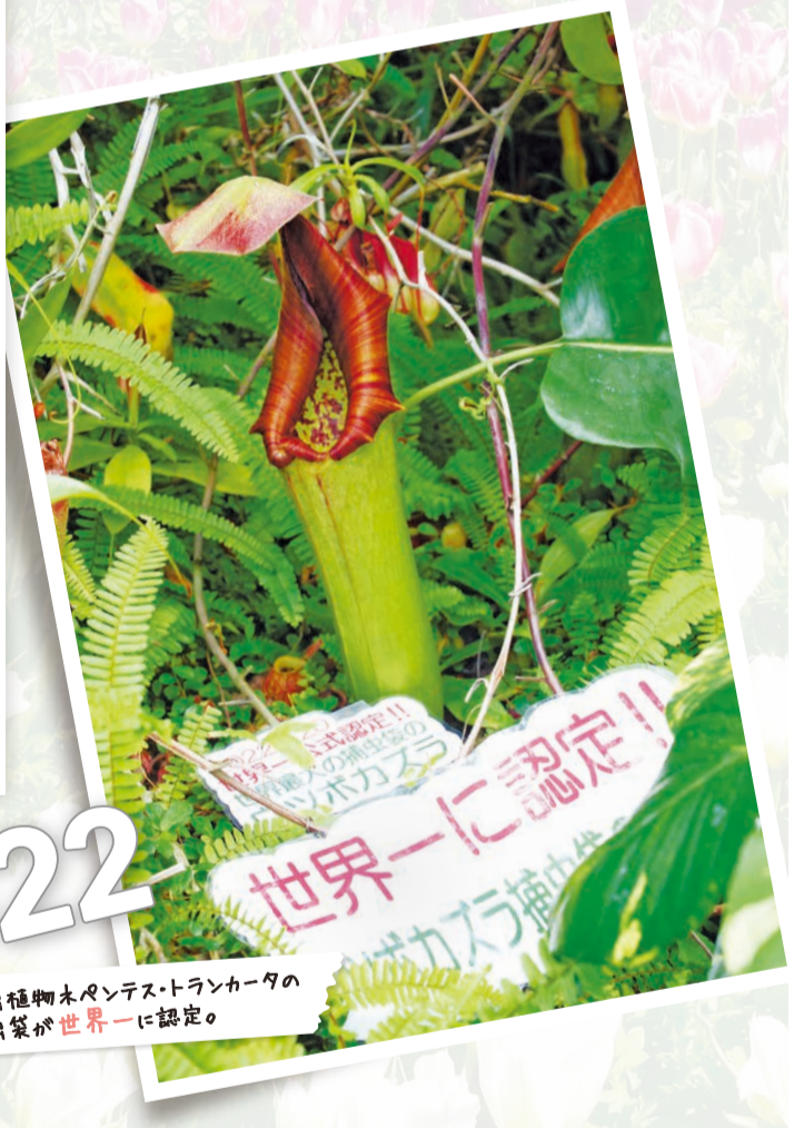
食虫植物木ペンデストランカーダの捕虫袋が世界一に認定。