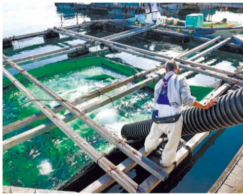
神河町で中間育成したサクラマスを、福良湾内に設置した淡水から海水に慣らすためのプールに放つ作業。

2022年5月に神河町で開催された物産展の意見交換会で「県内産の稚魚でサクラマスを養殖したい」と話したところ、アマゴやアユを養殖している長谷漁業協同組合が手を挙げてくれました。今年の出荷分のうち、神河町で育てた稚魚から養殖したものはまだ4分の1ですが、来年には半分にまで増やしたいと思っています。