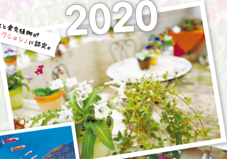
ストレプトカーパスと食虫植物が「ナショナルコレクション」に認定。 (写真は2021年)