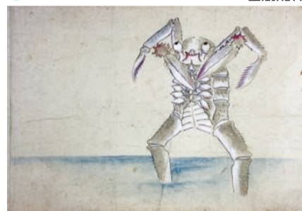
筑前化物絵巻 蟹の床の怪物 個人蔵 鞍手町歴史民俗博物館寄託