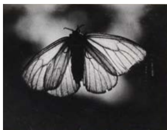
《蛾（1）》 1934年 個人蔵（兵庫県立美術館寄託）

日時：毎週日曜日 11時～11時15分 会場：レクチャールーム 定員：60名（先着順）