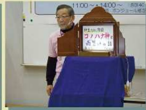
ボンジュール紙芝居公演