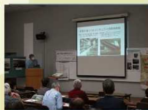
神戸空襲の記憶を語る