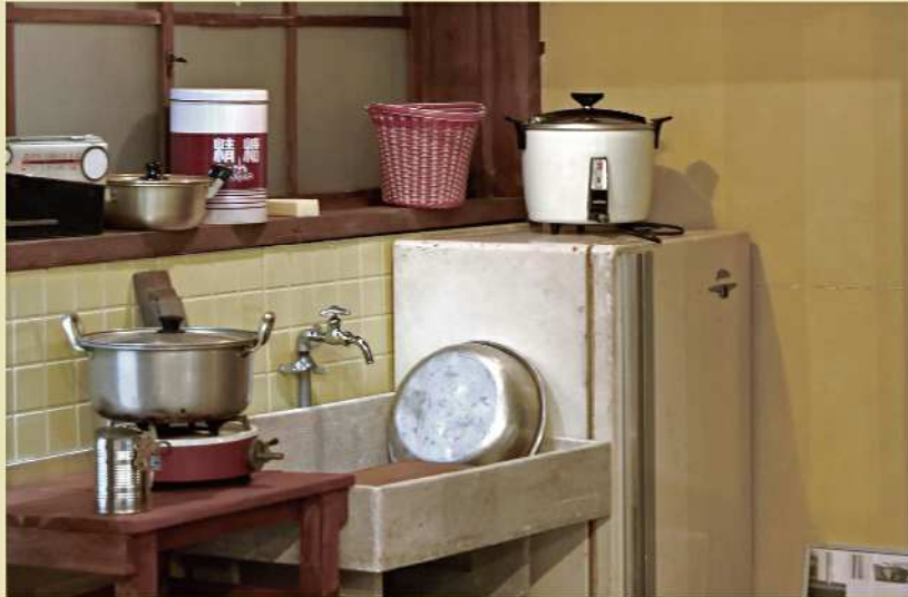
昭和30年代の台所（再現）

神戸市埋蔵文化財センターでは、平成18年度の冬季企画展『昭和の暮らし・昔の暮らし』以降、毎年この時期に「昭和」の時代をとりあげた展示を企画してきました。