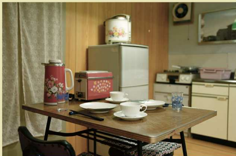
下：昭和40年代のダイニングキッチン（再現）