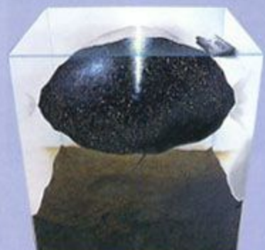
佳作「『のしてんてん』」神戸市東灘区(神戸市)