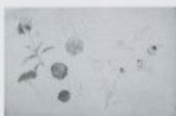
小磯良平「てんでん虫と花」1940年 水彩、鉛筆 小磯良平「顔面を見る女」1940年 鉛筆

小磯良平は端正で正確なデッサンで知られています。そこには形の表現に対する追及心とたゆまぬ努力がありました。本特集では素描と版画作品によって、小磯芸術におけるデッサンの探求を明らかにします。