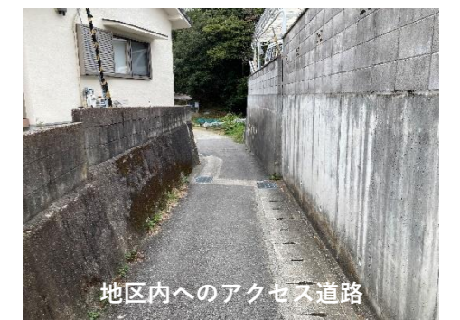
地区内へのアクセス道路