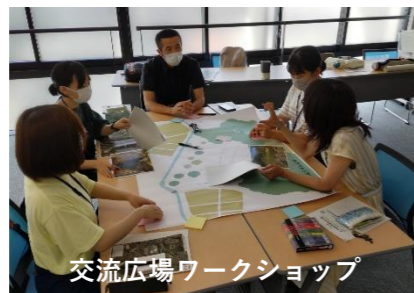
交流広場ワークショップ