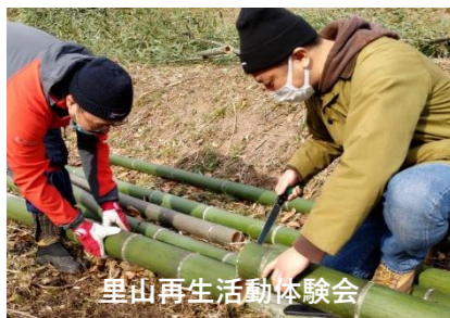
里山再生活動体験会