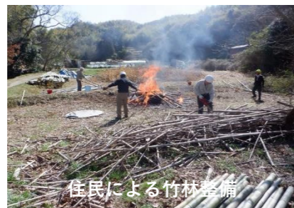
住民による竹林整備