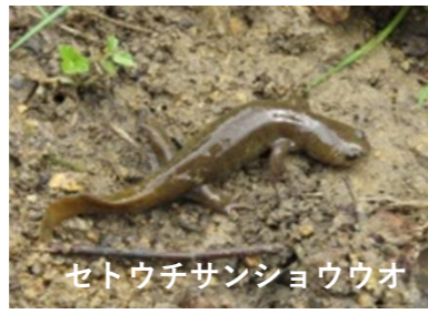
セトウチサンショウウオ