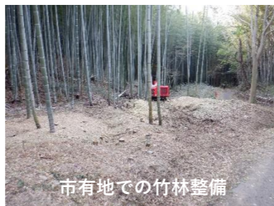
市有地での竹林整備