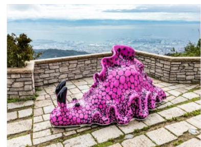
③灰野ゆう「あめふらし」 六甲ミーツ・アート 芸術散歩2020