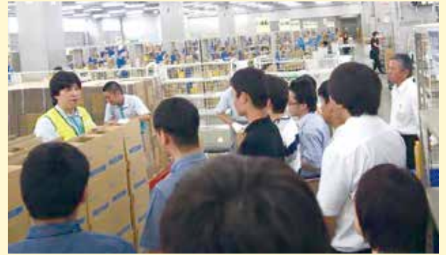
写真は、花王ロジスティクス(株)の見学風景 (市立あけぼの学園)