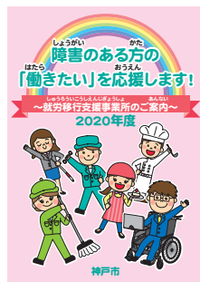
就労移行支援事業所のご案内