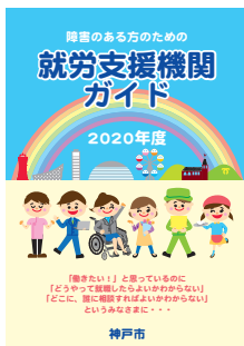
就労支援機関ガイド