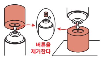
내용물 배출 방법의 예시