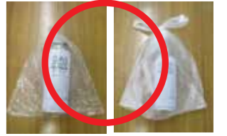
※내용물이 보이는 봉지의 예시

3 타는 쓰레기와 구분하여 내용물이 보이는 봉지(15L까지)에 넣어 주십시오