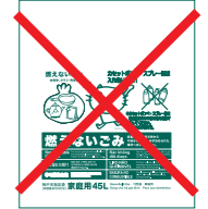
※지정 봉지는 불가

4 클린 스테이션(쓰레기 지정 배출 장소)에 타는 쓰레기와 장소를 구분하여 배출해 주십시오