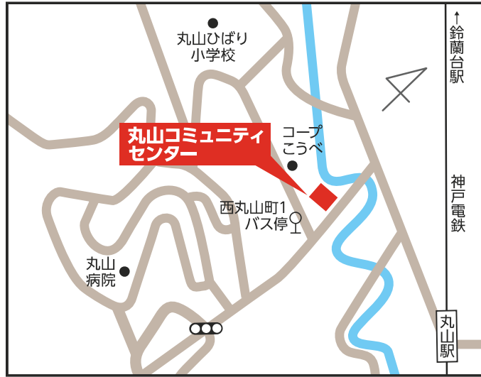
丸山コミュニティセンター 【長田区西丸山町1-7-5】