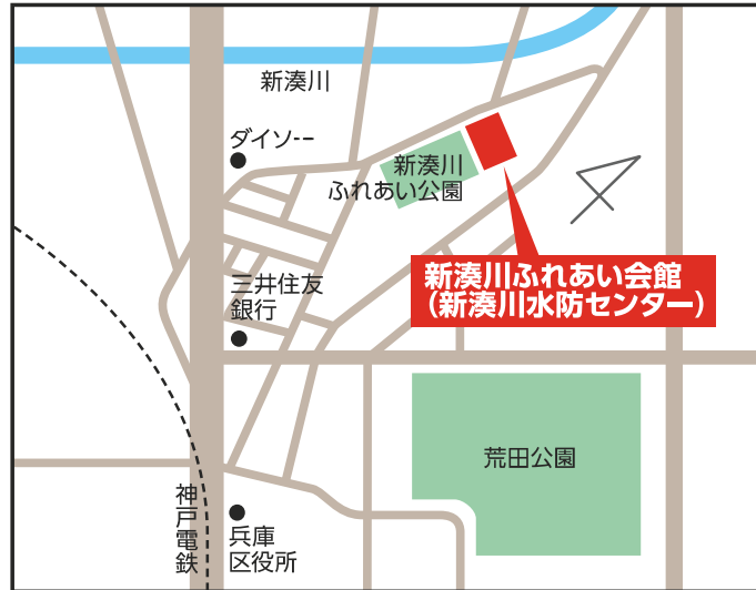
新湊川ふれあい会館(新湊川水防センター) 【兵庫区東山町1-9-20】