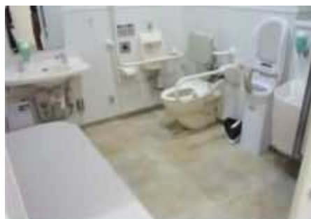
※多目的トイレの例