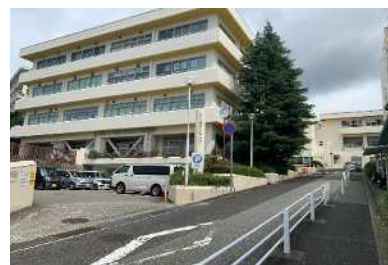
現在の北区文化センター

また、これらの課題解消のため、施設の現地建替えを行う場合、施設の構造や立地条件などから、大規模な改修となることや休館期間ができることで市民サービスの低下が懸念される。