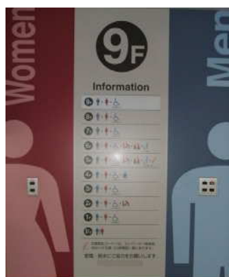
※トイレ案内サインの例