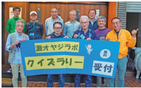
<↑「新たなコミュニティの創出」による活動>

区では、地域支援コーディネーターに地域の方々の力を最大限に活かしたまちづくりを応援していただく業務を平成15年より委託しています。令和4年度は、「子育て支援」「人と人がつながるまちづくり」「新たなコミュニティの創出」「地域団体自立活動支援」の分野で知識を有する方を募集します。区役所と一緒に地域の力があふれるまちを作りませんか。