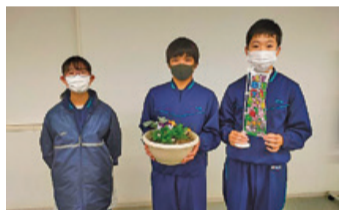
<↑パンジー、シロタエギクなどをいただきました>

市立上野中学校の皆さんから「トライやる・ウィーク～花の宅配便～」として、寄せ植えのお花をいただきました。生徒の皆さんで種から育てられたそうです。いただいたお花は区役所で大切に育てます。