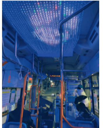
<↑タンタンが転がるアニメーションです>

コロナ禍でも頑張っている坂バスを、地域みんなで応援するべくクラウドファンディングを実施しました。集められた資金で、車内の天井にイルミネーションを設置しています。摩耶山掬星台の星空を再現しており、とても綺麗です。また、王子動物園のタンタンや摩耶ロープウェイなど沿線をイメージしたアニメーションも流れ、目的地までの時間をより楽しめます。ぜひご乗車ください。