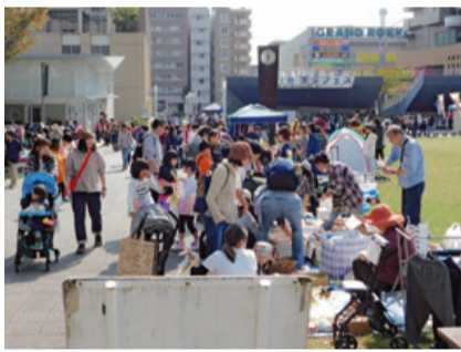
<↑※今年度は屋内で開催します>

今回で2回目となる「ボランティアフェスティバル」を開催します。ステージではボランティアによるパフォーマンス、体育館では障害者スポーツ体験、物販コーナーなど、内容は盛り沢山で、子どもから大人まで楽しめるイベントです。ぜひお越しください。