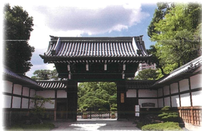
総ケヤキづくりの正門

蘇鉄園や樹齢500年以上と伝えられる大クスノキ、春のツツジや秋の紅葉も見事です。また園内には、国の重要文化財に登録されている「旧小寺家厩舎」「旧ハッサム住宅」「船屋形」もあり、四季折々で姿を変える日本庭園とともに、その景観をお楽しみいただけます。