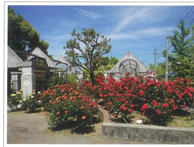
高塚公園のバラ園

ちなみに、「バラを育てるのはむずかしそう?」、「家のバラがうまく育ててへんわ!」という方、必見!毎年1月と8月に剪定講習会が開催されていますので、是非一度、ご参加を。