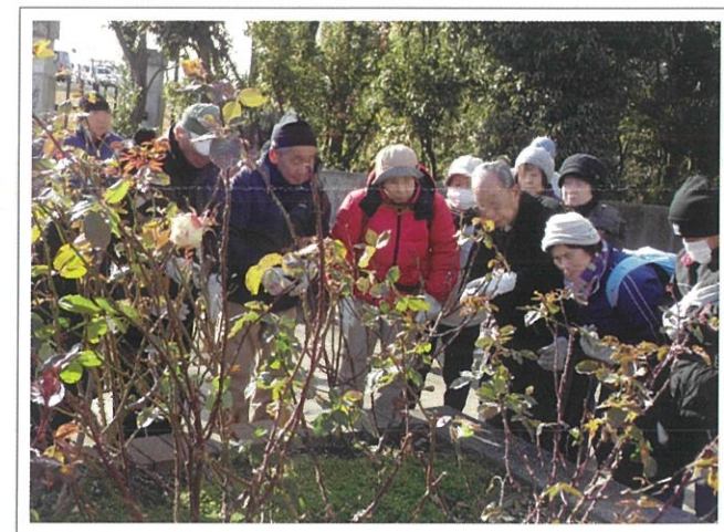
剪定講習会の様子(冬)