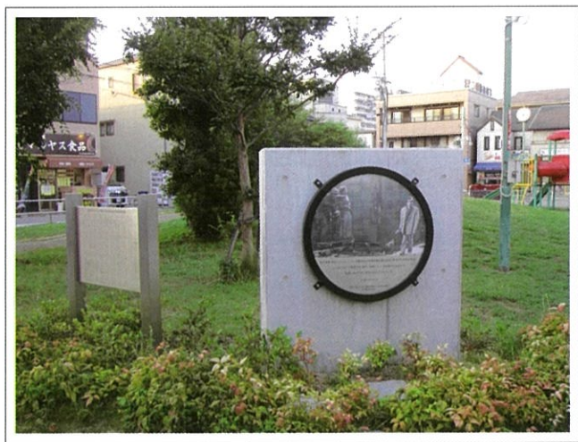
ロケ地記念モニュメントの全景