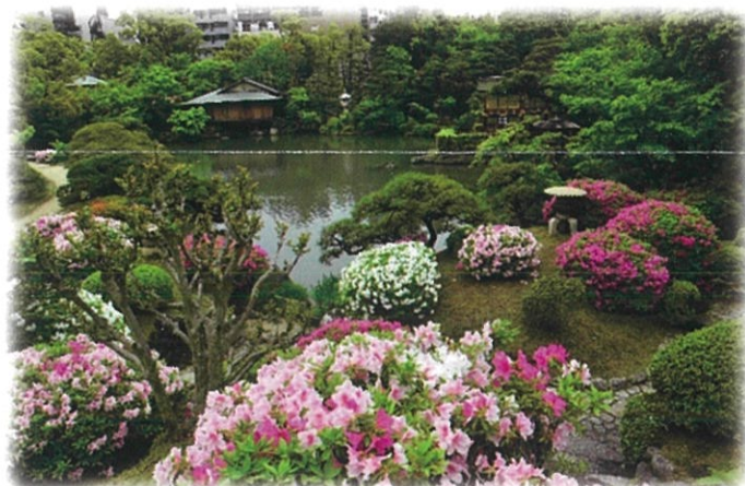
春はツツジで華やかに