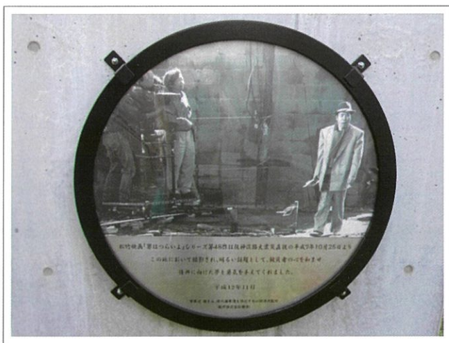
撮影の様子を写す記念碑