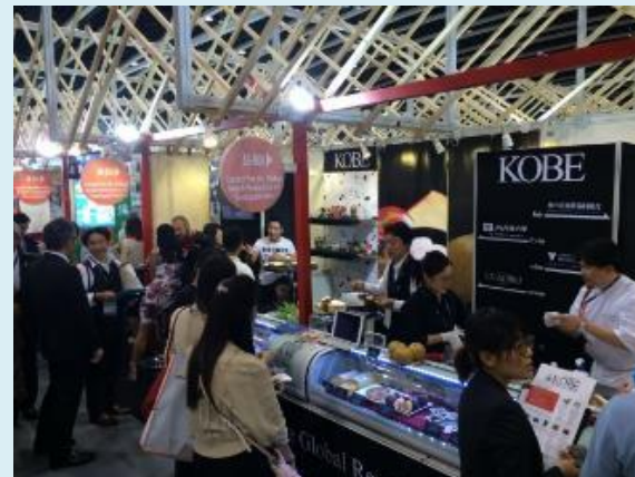
香港フードエキスポへの出展