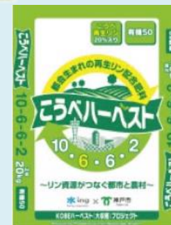
下水由来のリンを配合