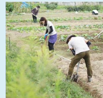
マイクロファーマーズスクール