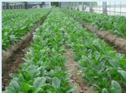
ほうれん草 年間1,400トン