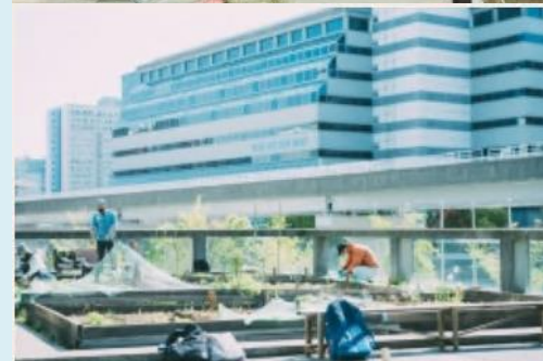
シェラトンファーム