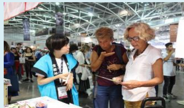
イタリア・トリノの「食」の博覧会への出展