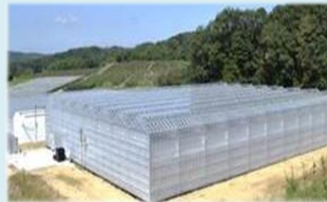
ICTを活用した 大規模園芸施設 (神戸フルーツ・フラワーパーク)