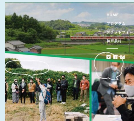
神戸農村スタートアッププログラム