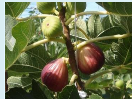
いちじく 年間300トン