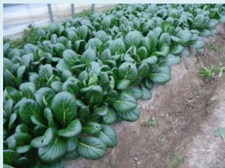
コマツナ 年間2,200トン