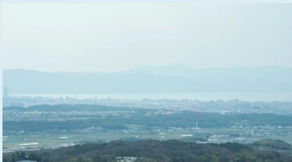
種はおよぐ：食と里のつながり