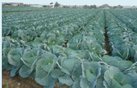
キャベツ 年間4,200トン