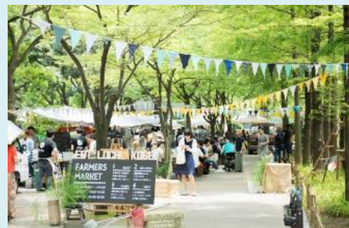
ファーマーズマーケット