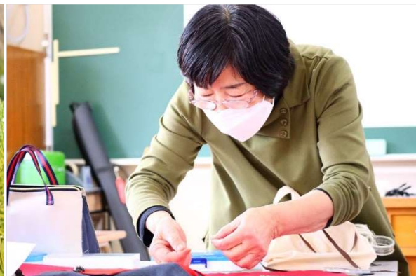
婦人子供服 秋國マイスター