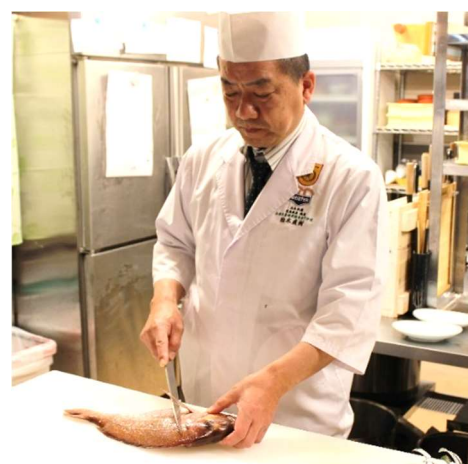
日本料理 柏木マイスター