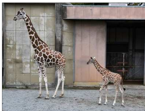
キリン (令和4年9月誕生)