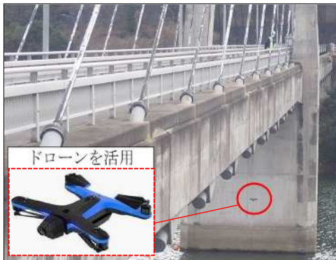
橋梁点検（北区 衝原大橋）

また、緊急輸送道路において、橋梁の耐震化を進めるとともに、路面下空洞調査を計画的に実施し発見した空洞を速やかに補修する。