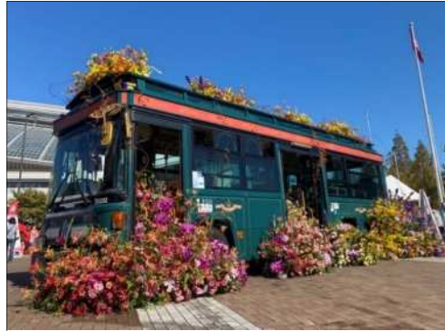
花によるアートの演出 (兵庫区)