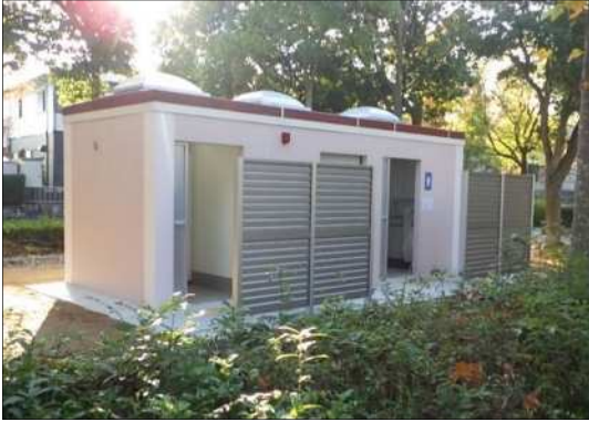
公園トイレチェンジアクション (西区 狩場台公園)

さらに、街路樹については、危険木等の撤去や樹種転換を進める街路樹再整備を推進する。