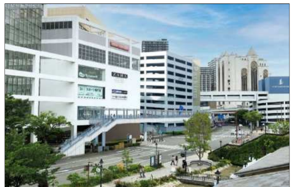
ハーバーランド東（弁天）デッキ 延伸イメージ