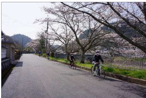
神出山田自転車道 シェアサイクル（北区）