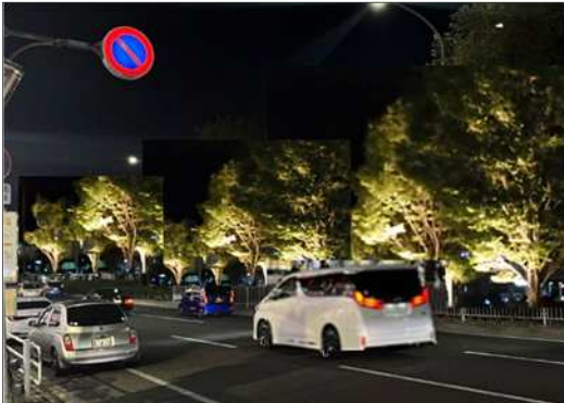
樹木のライトアップイメージ (中央幹線：三宮駅～元町駅)

都心部における上質で明るい夜間景観を形成するため、三宮・元町駅周辺の樹木やベンチのライトアップ等を行う。