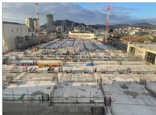
西部処理場北系整備（長田区）