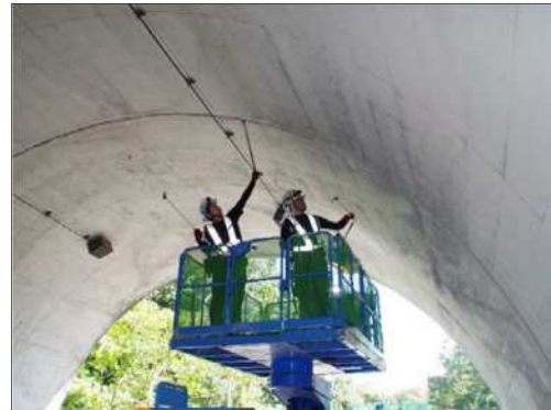
トンネル点検（北区 福地トンネル）