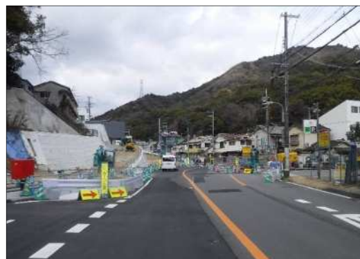
垂水妙法寺線（須磨区 明神町）