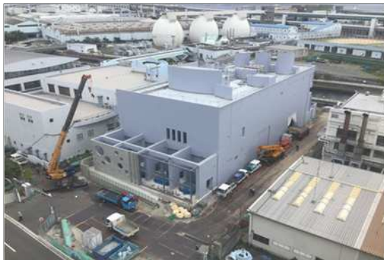
魚崎ポンプ場改築更新事業(第1期) (東灘区)