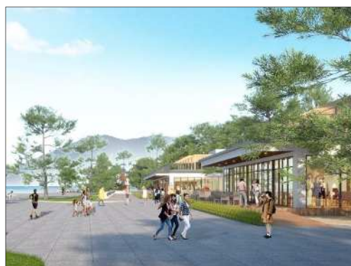
にぎわい施設・園内イメージ