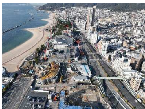
令和4年12月の再整備状況