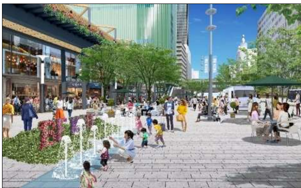
三宮クロススクエア（第2段階） 東側整備イメージ