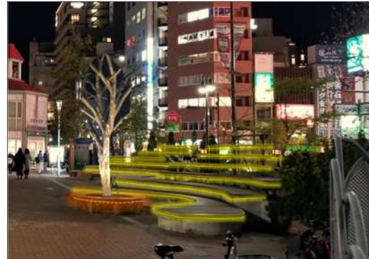
ベンチのライトアップイメージ (元町駅前)