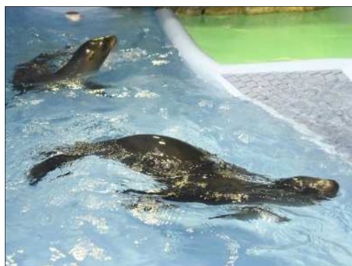
カリフォルニアアシカ (令和4年6月誕生)

また、SNSの発信や園外でのデジタル広告掲示等の広報機能の充実を図るとともに、園内で実施するイベントや講座を動画配信するなど、幅広い層が学び楽しめる取り組みを実施する。