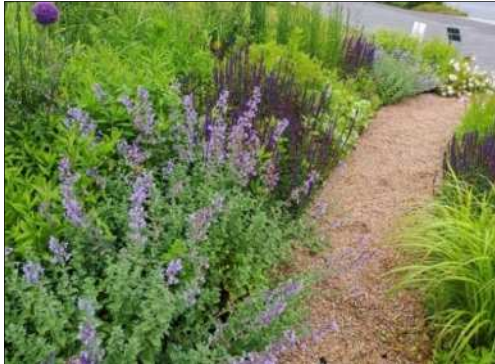
Naturalistic Landscapingによる植栽整備 (中央区)

磯上公園や京町筋等において、高度な造園技術を活用した、自然を感じる風景を創出する「Naturalistic Landscaping」による植栽整備を行う。