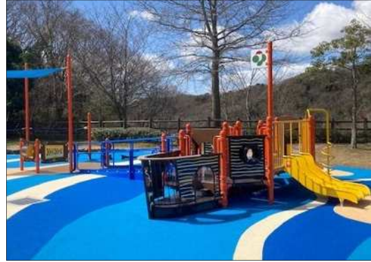
インクルーシブ遊具 (北区 しあわせの村)