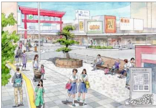
地下鉄長田駅前空間イメージ