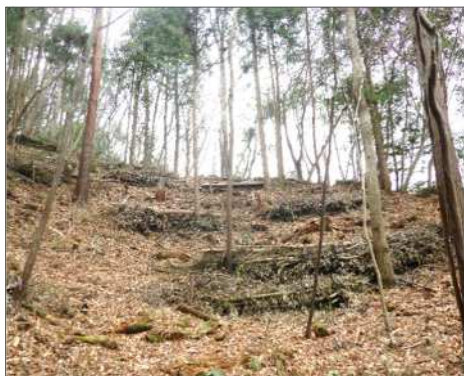
広葉樹林整備（北区 有野町）

さらに、「KOBE里山SDGs戦略」を踏まえ、北区淡河町の私有林をモデル地区として、民間企業等と連携し持続可能な里山の維持管理を目指した取り組みを促進する。