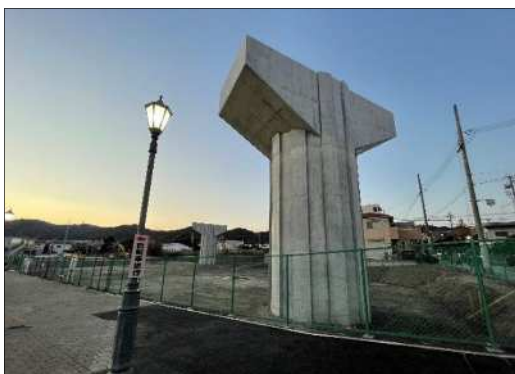
須磨多聞線（須磨区 天神町）