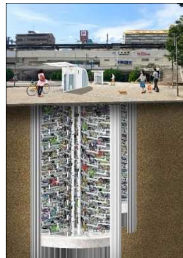
六甲道駅地下駐輪場イメージ