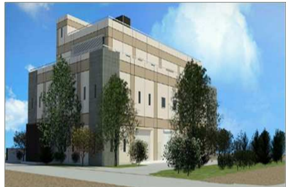
新東川崎ポンプ場イメージ(中央区)