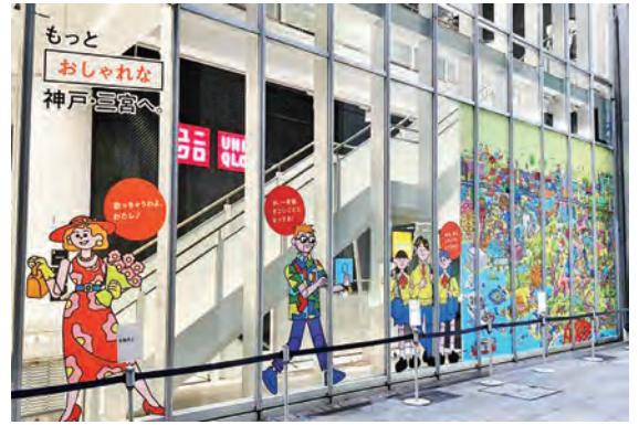
ユニクロ 神戸三宮店

イラストの制作者はイタリア出身のイラストレーター、ビオレッティ・アレサンドロさん。かわいらしく特徴的なデザインが人気で、企業広告やキャラクターデザイン、子ども向けの絵本など多方面で活躍されています。