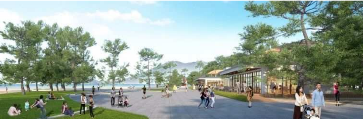
にぎわい施設イメージ