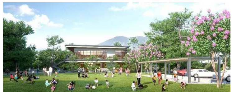
再整備後イメージ