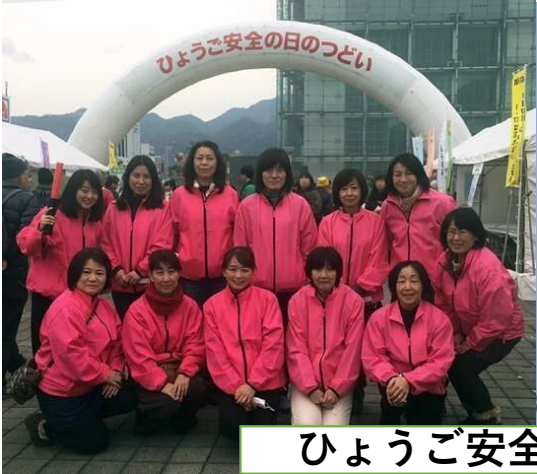
ひょうご安全の日のつどい