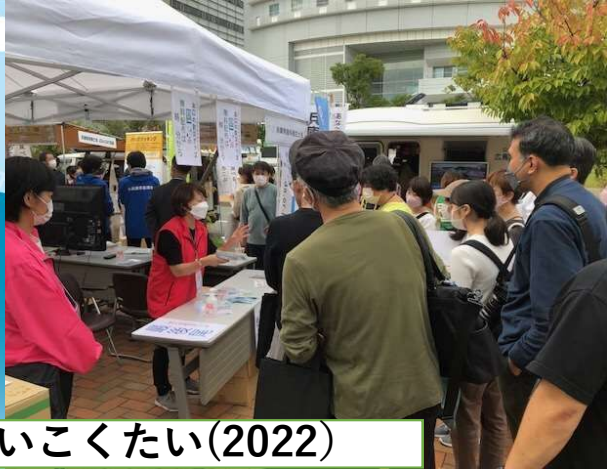
ぼうさいこくたい(2022)