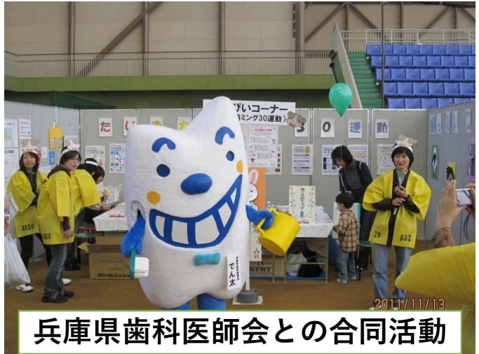
兵庫県歯科医師会との合同活動