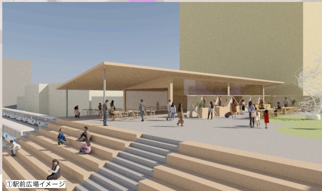
①駅前広場イメージ

岩屋駅付近の③のエリアでは森が大きく緩やかな階段状になり、駅前に小さな広場を形成します。ここは見た目にもわかりやすく、移動、滞在、イベントが自然に重なり合う、集まりの場となります。