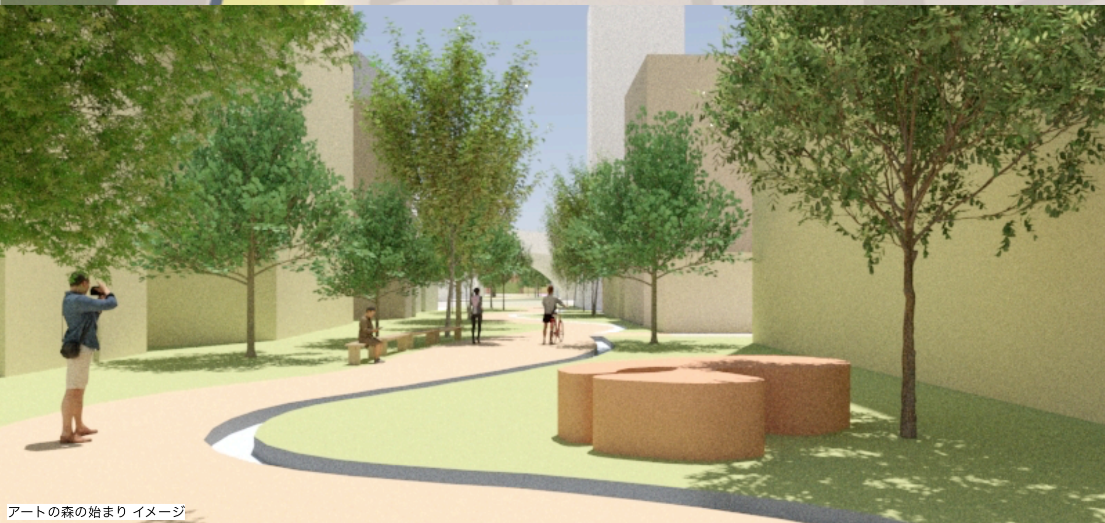
アートの森の始まり イメージ