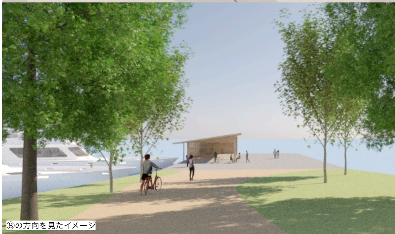
⑧の方向を見たイメージ

また、この地域で生活する人々にとっても、そういった文化が身近に、日常の中に溶け込むこととなります。集会場・コミュニティスペースとして、北側のエリアからいくつか設けている場所は、地域の人々の利用をメインとしており、町の公民館のような役割をアートの森の中に取り込むことで、ミュージアムロードが誰にとっても開かれた空間となることを想定しています。