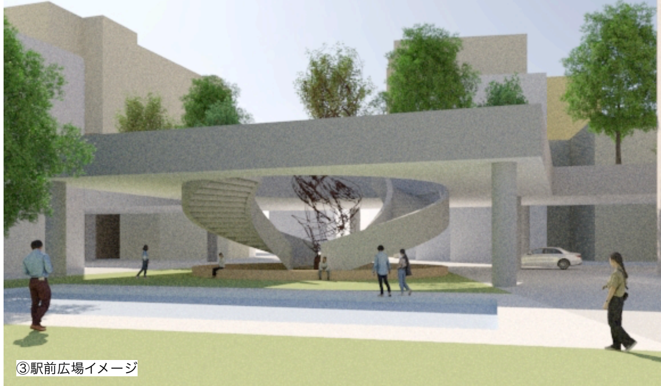
③駅前広場イメージ