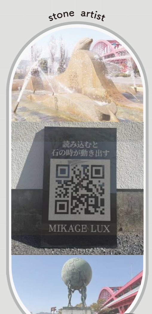
企業：石襖石材 兵庫の地で廃店二年に創業。石の選定から施工まで、一つひとつに心を込め、厳選した良質な石材のみをご提案・使用しています。