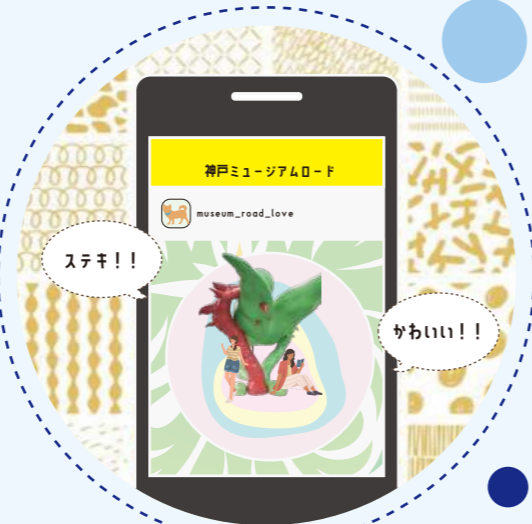
WEB空間 アートを発信・表現する場