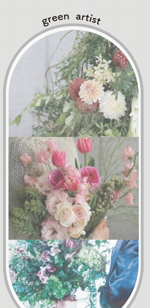
企業：ヘブンデュオ 「花・空間・香り・音」花を感じる楽しさ、花の魅力が様々なシーンに合わせて彩り豊かな暮らしを発信します