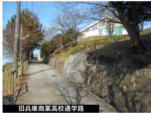
旧兵庫商業高校通学路