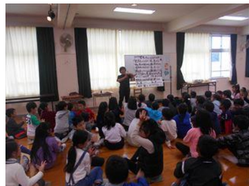
手話の体験学習の様子（塩屋小学校）