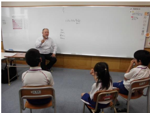
グループ指導の様子（神戸祇園小学校）