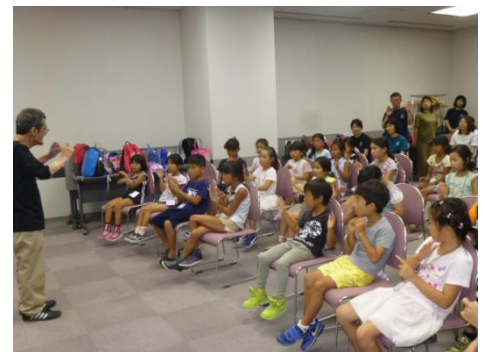
子ども手話教室（区社協）