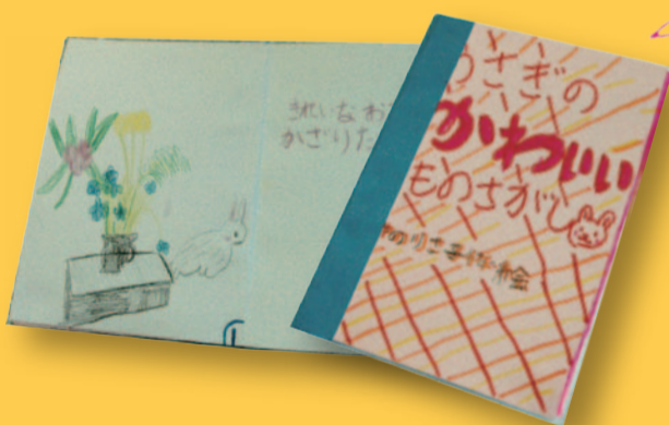
かわいいうさぎの大冒険！