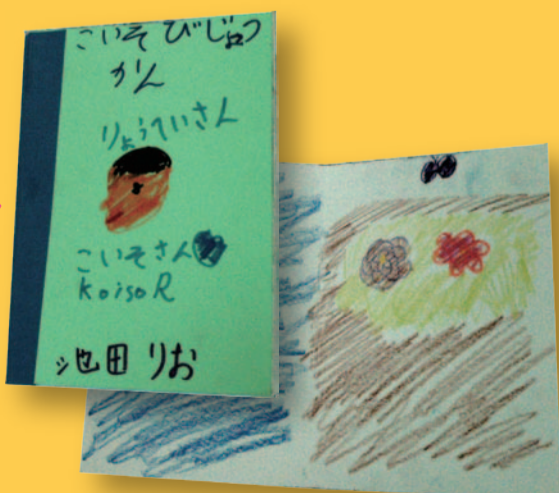
こいそさんの似顔絵が表紙に♪