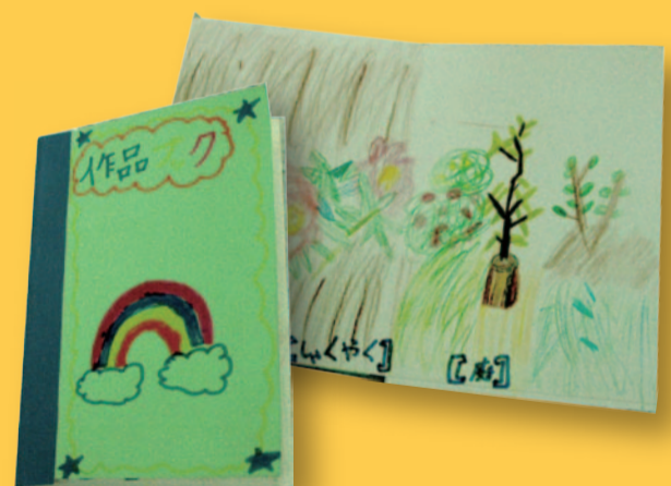
まるで植物図鑑みたい